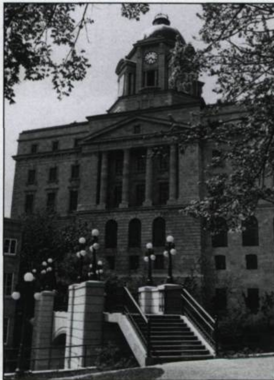
Réaménagé en 1914, le bureau de poste de Québec, est désigné depuis 1984 sous le nom d'édifice Louis-Saint-Laurent. (Environnement Canada, Parcs).

L'arrangement avait évidemment une saveur politique, au détriment de Stayner, qui protesta vigoureusement, alléguant qu'il aurait pu avoir beaucoup plus et réclama vainement la plus-value, vu que le terrain avait été acquis par lui uniquement pour servir au bureau de poste.