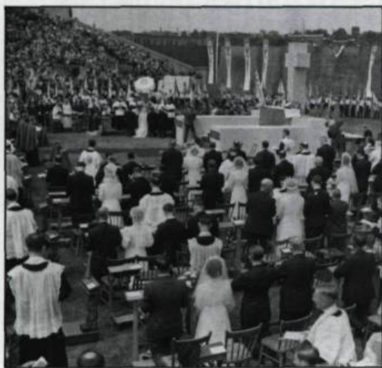
En 1939, la jeunesse ouvrière catholique organise à Montréal une cérémonie de 105 mariages collectifs. (The Gazette, Archives nationales du Canada, PA-137214).

Dans le milieu de la confection, on qualifie cette période un peu nostalgiquement, d'époque des beaux mariages. Les journaux de fin de semaine consacrent une rubrique importante au mariage décrivant, photos à l'appui, les toilettes arborées pour l'occasion. Ils constituent une source privilégiée de renseignements sur la mode, les usages et les coutumes de l'époque.