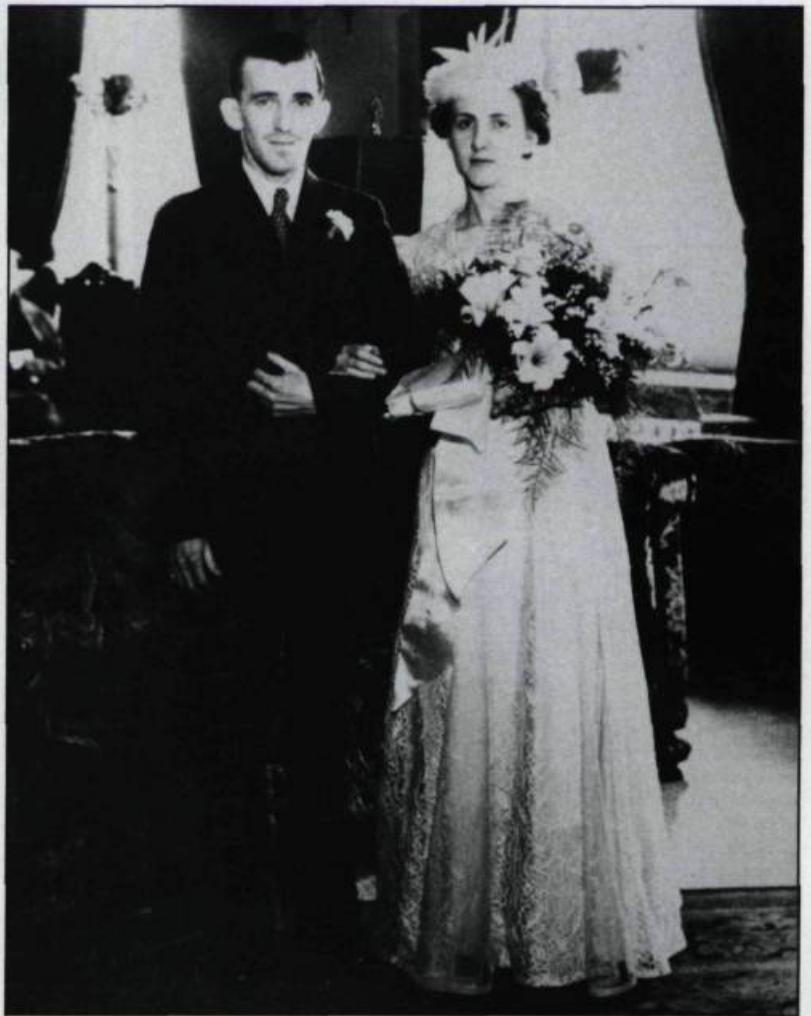
Mariage en juin 1939 à Québec. La robe est de tulle et de dentelle rose pâle.

Six ans plus tard, en 1944, au moment où la guerre impose de nombreuses restrictions, la robe de mariée revêt un cachet plus usuel, car il n'est plus possible dans ce contexte de concevoir