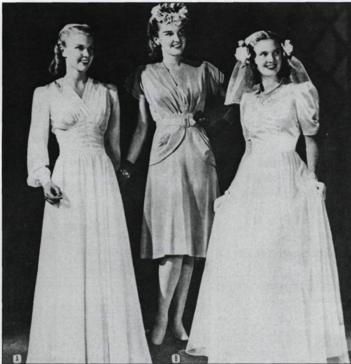
Quelques robes de mariées présentées dans le Catalogue Eaton (automne-hiver 1945-1946).