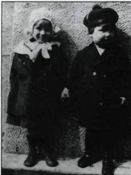
Deux types de coiffures d'enfants en 1922.

(Dessin de Luc Lessard, étudiant en techniques du vêtement, campus Notre-Dame de Foy, Cap-Rouge).