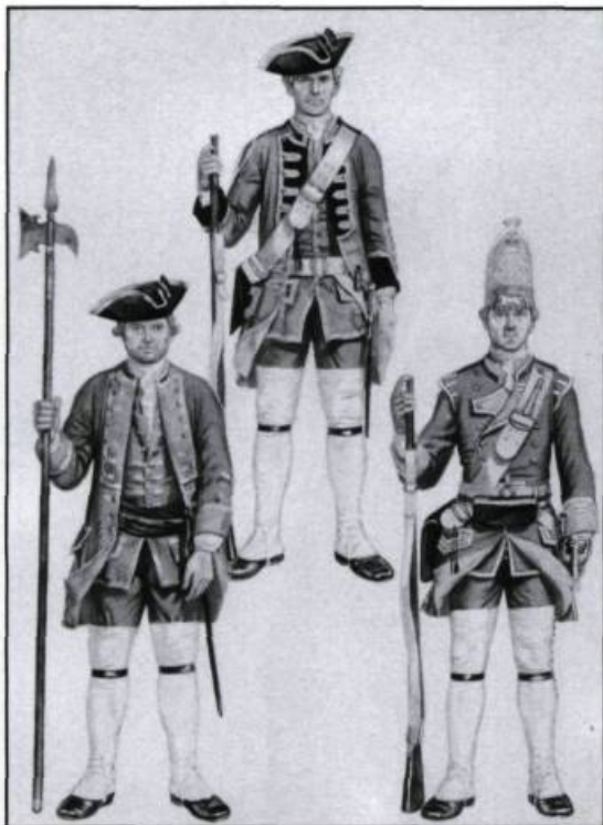
Costumes de divers régiments britanniques au moment de la Conquête. Reconstitution de G.A. Embleton. (Environnement Canada, Parcs).

datés vêtus d'un costume militaire identique. Le jeune roi Louis XIV avait ordonné à des troupes de l'armée royale de rétablir la situation au Canada. Les quelque mille officiers et soldats du régiment portaient tous un uniforme. Il s'agissait d'un concept alors tout nouveau dans l'armée française que de faire porter une tenue «de même parure» à des régiments entiers. Ceux de Carignan portaient un uniforme brun dont la doublure était grise, ce qui était visible aux manches dont les revers étaient retroussés. Les boutons étaient d'étoffe, gris aux parements et bruns ailleurs. Le chapeau était noir. Conformément à la mode