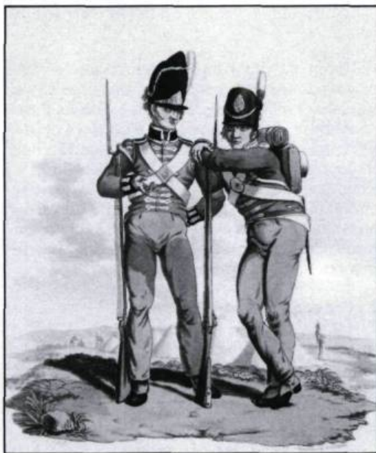
Soldats d'infanterie britannique vers 1815. Celui de gauche appartient au 23 e Royal Welsh «Fusiliers», et celui de droite au 6 e régiment. (1 er Warwickshire Regiment).

datés vêtus d'un costume militaire identique. Le jeune roi Louis XIV avait ordonné à des troupes de l'armée royale de rétablir la situation au Canada. Les quelque mille officiers et soldats du régiment portaient tous un uniforme. Il s'agissait d'un concept alors tout nouveau dans l'armée française que de faire porter une tenue «de même parure» à des régiments entiers. Ceux de Carignan portaient un uniforme brun dont la doublure était grise, ce qui était visible aux manches dont les revers étaient retroussés. Les boutons étaient d'étoffe, gris aux parements et bruns ailleurs. Le chapeau était noir. Conformément à la mode