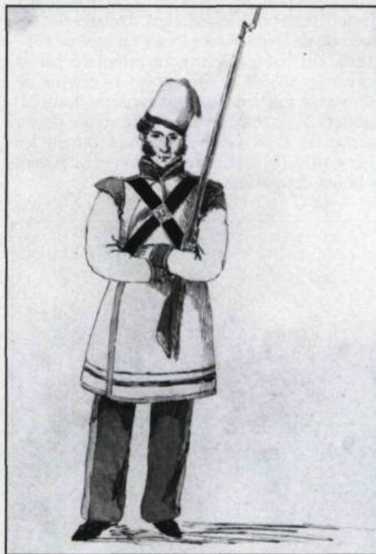
Un milicien du corps des «Quebec Volunteers» durant les rébellions de 1837-1838. Dessin réalisé par Sir James Archibald Hope.

Contrairement à l'opinion répandue, les Britanniques ne portaient pas que le rouge. L'artillerie – le « Royal Artillery » qui eut toujours un fort déta-