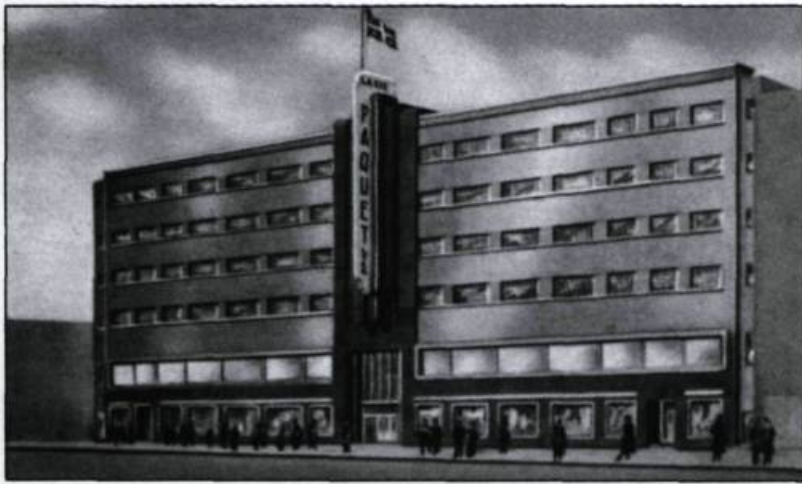
Le nouveau siège social de la Compagnie Paquet limitée, boulevard Charest, Québec, vers 1950. (Carte postale, collection Yves Beaugard).