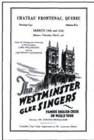
Concert donné par les chanteurs de la Westminster Glee Singers de passage à Québec à la fin de la décennie 1920.