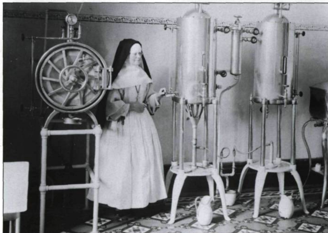
Premier appareil de stérilisation utilisé à l'Hôtel-Dieu de Québec. Photographie prise en 1918.