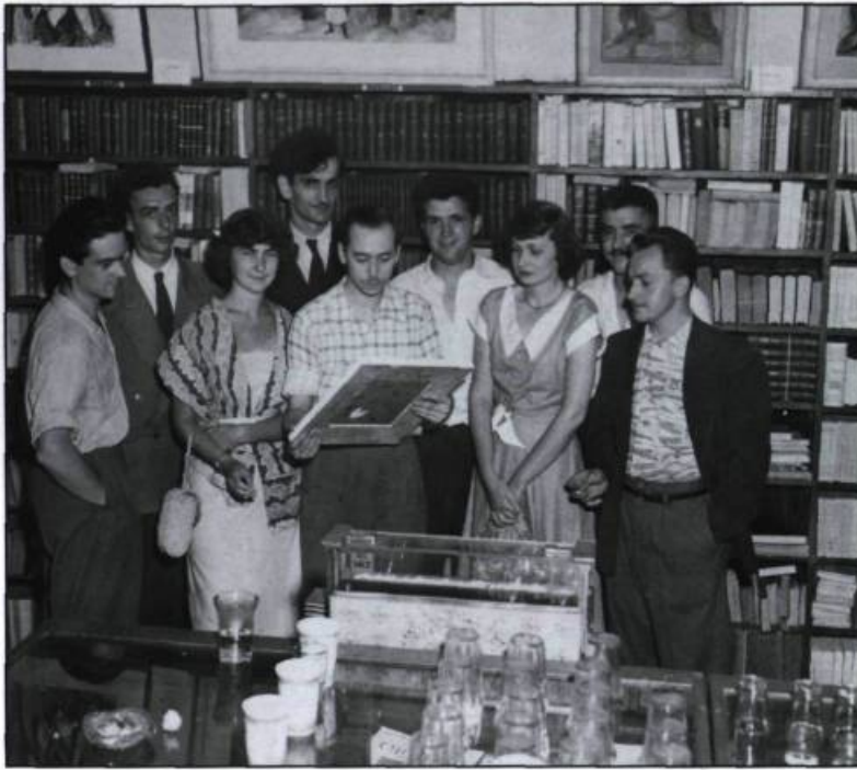
Groupe de jeunes artistes lors du vernissage d'une rétrospective présentée à la librairie Tranquille du 31 juillet au 31 août 1948.