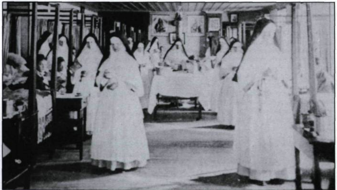
Chambre de malade à L'Hôtel-Dieu de Québec à la fin du XIX e siècle. (Archives du Monastère de L'Hôtel-Dieu de Québec).

Les guerres iroquoises déciment les populations amérindiennes qui fréquentent l'hôpital. Par contre l'arrivée du régiment de Carignan et de