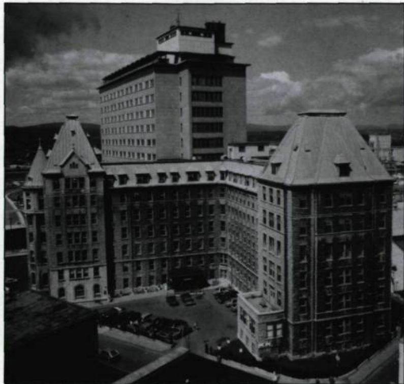
L'hôpital Hôtel-Dieu de Québec aujourd'hui.

En 1931, la restauration complète du bâtiment et l'ajout du pavillon Richelieu et de l'aile du Précieux-Sang permettent de porter le nombre de lits à 375. Par la suite, l'ensemble architectural subit une seule transformation majeure, soit l'addition d'une tour de 14 étages qui remplace, à la fin des années 1950, l'ancien pavillon d'Aiguillon.