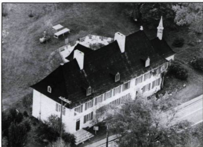
Vue à vol d'oiseau du manoir et de la chapelle ajoutée en 1929 par le juge Pouliot en l'honneur de ses deux fils Jésuites.

L'amélioration de sa condition de vie lui fait délaissier temporairement son projet d'agrandissement vers l'ouest. Il opte pour un projet plus ambitieux dont la première phase consiste à exhausser sa première habitation d'un étage dans le but de la transformer éventuellement en édifice à deux étages. Cette phase donne naissance à une maison étroite à deux étages qui permet à Mauvide de s'identifier aux bourgeois de la ville de Québec. Ce geste dévoile l'ambition de Mauvide: construire une maison monumentale.