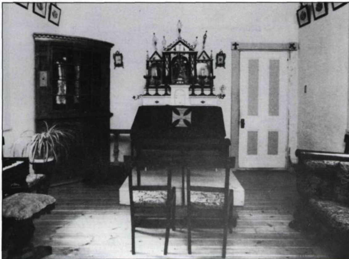
Intérieur de la chapelle adjacente au manoir. (Inventaire des Biens culturels).