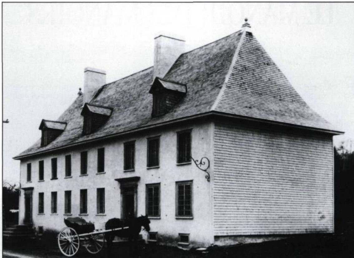
Partiellement restauré, en 1926, par le juge J.-Camille Pouliot, le manoir retrouve alors son crépi en façade et la cheminée centrale de la première habitation.