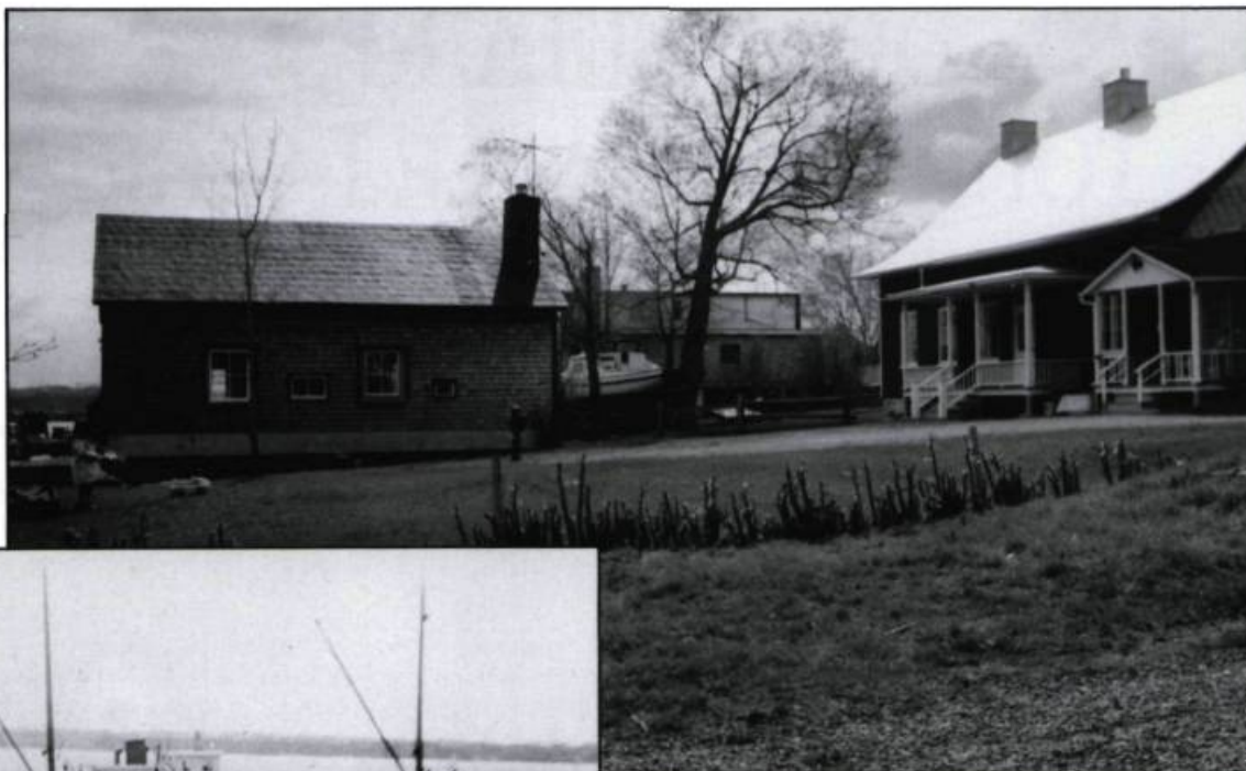
La chalouperie Jean-Baptiste Dumas à Saint-Laurent.