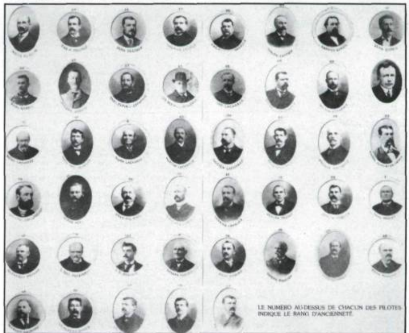
LE NUMÉRO AU-DESSUS DE CHAQUE UN DES PILOTES INDIQUE LE RANG D'ANCÉNNETÉ.

Ces accidents terribles incitent les pilotes à se regrouper en corporation professionnelle pour devenir propriétaires de leurs goélettes. Née en 1860, la Corporation des pilotes du Bas-Saint-Laurent compte 3 présidents originaires de Saint-Jean au cours du demi-siècle qui suit sa fondation. Après 1870, le nombre des pilotes de Saint-