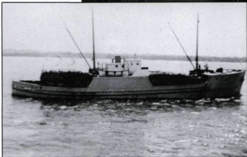
La goélette Orléans transportant un chargement de «pitounes». (Collection Roger Coulombe).

d'embarcations. Au XIX e siècle, un nombre important de ces artisans se concentre dans la paroisse de Saint-Laurent. Le succès des uns en a-t-il encouragé d'autres ou la configuration géographique de la terrasse en bordure du fleuve était-elle particulièrement favorable à cette industrie? Plus simplement s'agissait-il d'une vocation naturelle des natifs de cette paroisse? Dans ses Figures d'hier et d'aujourd'hui, à travers Saint-Laurent I.O. , Mgr David Gosselin écrit: « Cette science [...] est le patrimoine commun de presque tous les jeunes gens du village de Saint-Laurent, et même des enfants. Ils l'acquièrent pour ainsi dire, en s'amusant. »