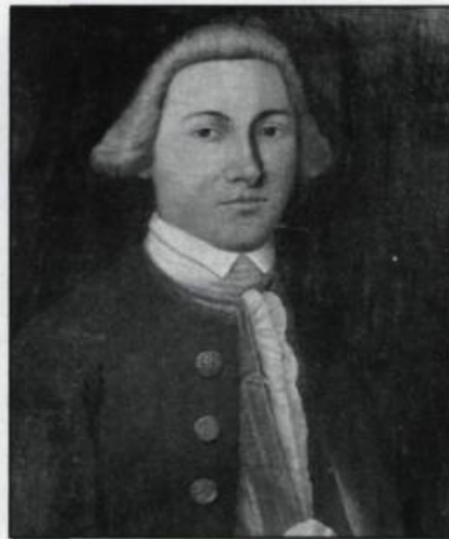
Anonyme. «Edward Antill III». Huile sur toile non signée.

L'état actuel de conservation nécessite un travail de restauration sur les deux toiles. Acquis en raison de leur ancienneté et de l'importance historique des modèles, elles se classent parmi les plus vieux portraits à l'huile de la collection du Musée du Québec.