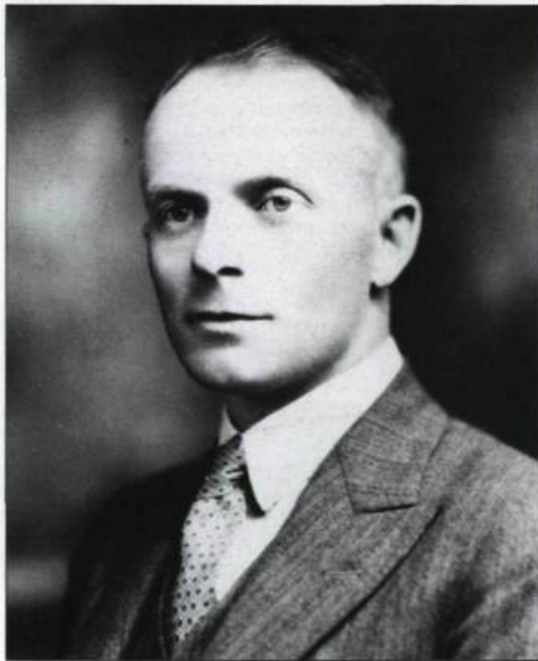
Adélard Godbout (1892-1956), agronome, professeur, et homme politique. Premier ministre de la province de Québec de 1939 à 1944, il présente lui même le «bill» accordant aux femmes le double droit de vote et d'éligibilité.

Adélard Godbout, qui a toujours voté contre le suffrage féminin, présente lui-même, en soutenant que les temps sont changés, le bill accordant aux femmes le double droit de vote et d'éligibilité.