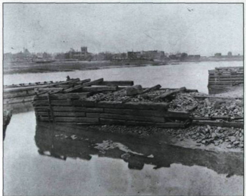
Vue de la rivière Saint-Charles à proximité de la fonderie F.-X. Drolet, le 20 novembre 1910. Toute trace des chantiers navals a disparu et certains quais sont en piètre état.

L'âge d'or de la construction navale s'amorce avec les années 1840. L'industrie prospère et produit près de 1 200 navires entre 1840 et 1870. Les navires de commerce et les barques constituent plus de 75 pour 100 des navires mis en chantier et 95 pour 100 du tonnage produit. Ces mastodontes sont financés par les marchands de bois: les Gillepsie, LeMesurier, Symes, Pemberton, Gilmour, Sharples, Burstall, Levey et Atkinson. Tous sont d'importants bailleurs de fonds de la construction ou de la distribution de ces bâtiments sur le marché anglais. Nul, cepen-