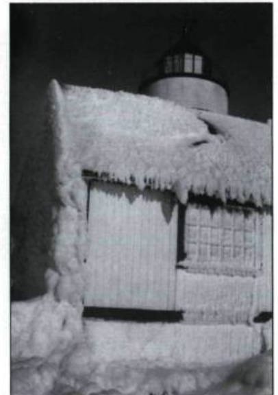
Images du phare de l'île Verte au cours de l'hiver 1963.