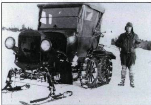
△ Différents prototypes de l'autoneige imaginés par J.-A. Bombardier. (Musée Bombardier, Valcourt).