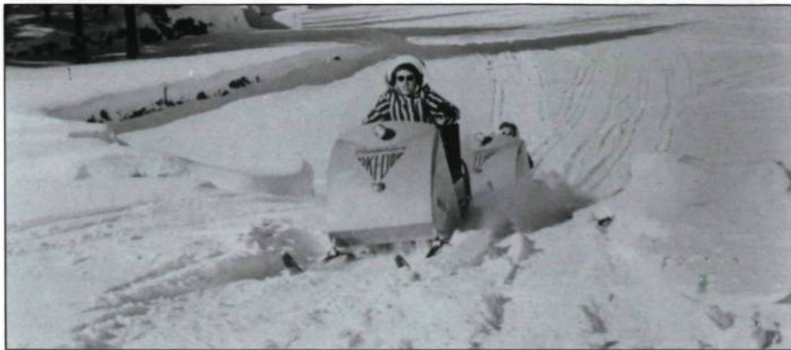
Inventée vers 1959, la motoneige propulse J.-A. Bombardier au rang de célébrité mondiale. Ici un modèle de marque Ski-doo des années 1960. (Musée Bombardier, Valcourt).

naissance, deux ans plus tard, à l'autoneige apte à transporter jusqu'à sept passagers. Au cours des années qui suivent, il fait breveter diverses inventions destinées à faciliter l'exploitation forestière et minière.