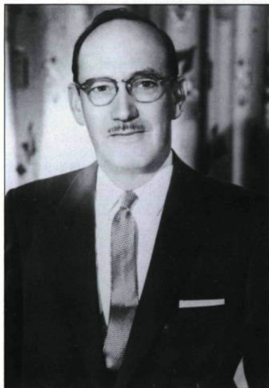
Joseph-Armand Bombardier (1907-1964).