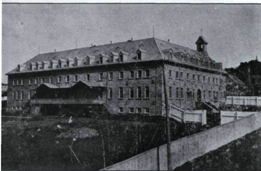
Les fils de saint François d'Assise reviennent à Québec en 1900 (école, rue Crémazie). En 1902, ils déménagent dans un tout nouveau monastère au 33, rue de l'Alverne. (Hormidas Magnan. Notes historiques sur la Banlieue de Québec. Le quartier Belvédère. La paroisse de Notre-Dame-du-Chemin. 1915).

Il serait prétentieux d'énumérer les «œuvres extérieures» de participation aux grands mouvements de l'Église où les frères mineurs sont les