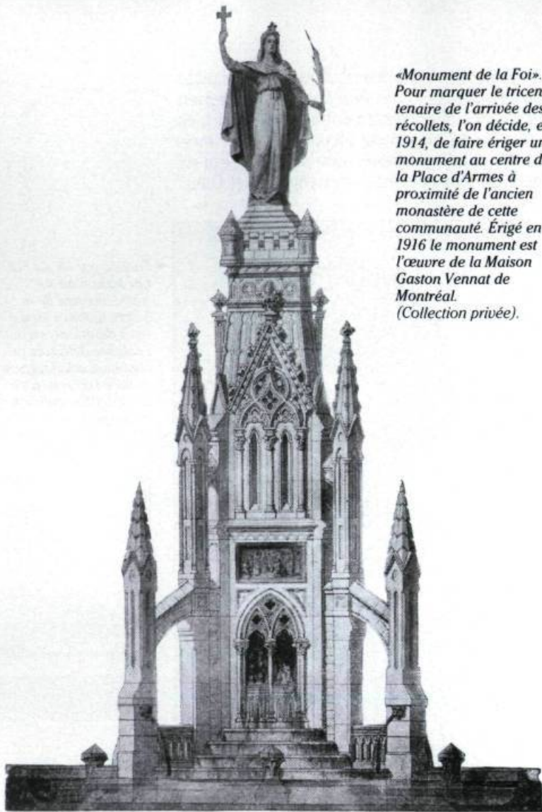
«Monument de la Foi». Pour marquer le tricentenaire de l'arrivée des récollets, l'on décide, en 1914, de faire ériger un monument au centre de la Place d'Armes à proximité de l'ancien monastère de cette communauté. Érigé en 1916 le monument est l'œuvre de la Maison Gaston Vennat de Montréal. (Collection privée).