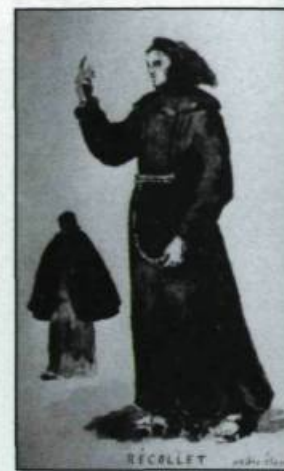
Les récollets débarquent à Québec le 2 juin 1615. Branche des Franciscains de l'Observance, ils se reconnaissent à leur bure grise. Le premier contingent amène les pères Denys Jamet, Jean Dolbeau, Joseph Le Caron, Pacifique Duplessis. (Illustrations de Henri Beau.).