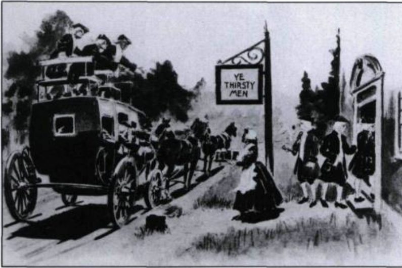
Relais et taverne en Nouvelle-Angleterre au XVIII e siècle. (One Hundred Years of Brewing, New York, Arno Press, 1974, p. 168).