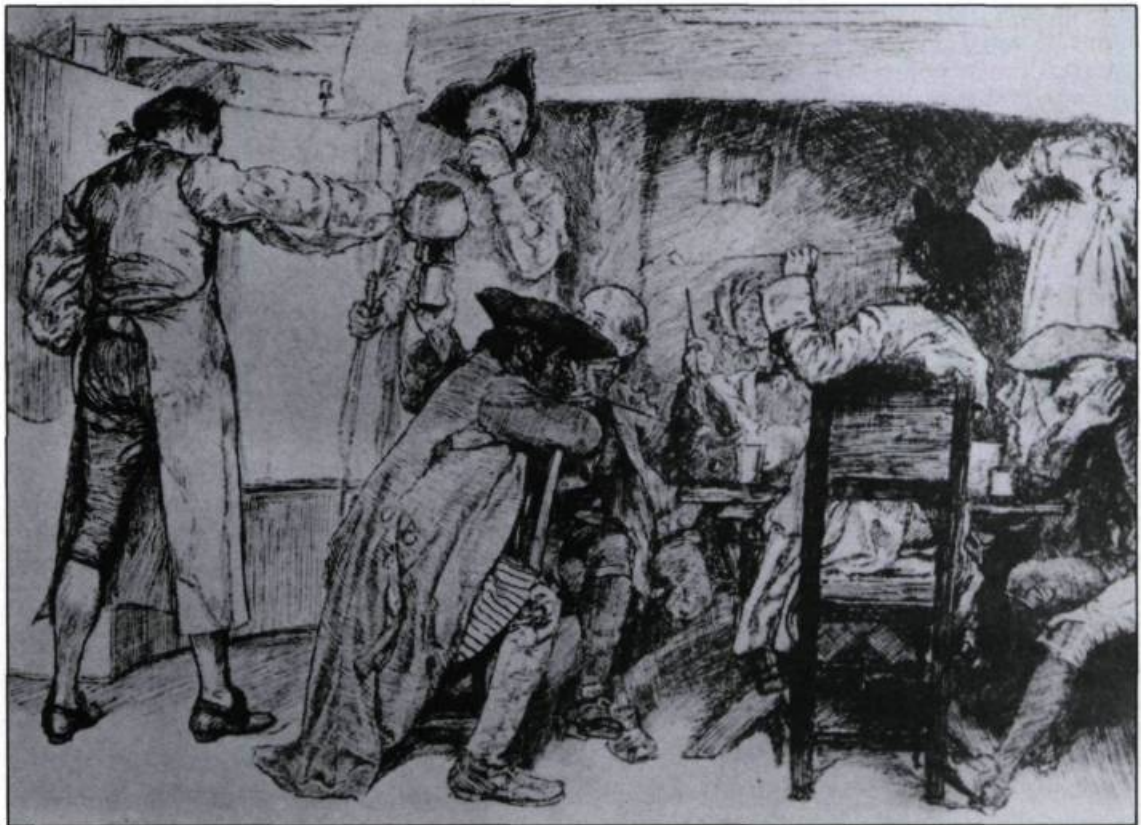
«A colonial ale-house». La colonie du Massachusetts se soumet à ces lois rigides de sobriété jusqu'en 1675. Par la suite, Boston multiplia ses points de vente et bientôt on déclara que chaque maison était devenue un lieu où consommer de l'ale. (One Hundred Years of Brewing, New York, Arno Press, 1974, p. 161).

Lors d'un premier essai de colonisation à l'île Roanoke (Caroline du Nord), Thomas Harriot écrit, à son retour en Angleterre, qu'une graine locale fut utilisée pour faire du très bon pain et qu'on en fit également du malt pour en brasser une bière jugée convenable pour le temps et qui, avec du houblon, aurait été meilleure. Aussi la Commission qui examina les besoins de la colonie en 1623 avait recommandé que les émigrants apportent une bonne quantité de malt pour fabriquer leur propre bière. En effet, à cause du climat, les grains cultivés dans le sud ne donnaient pas beaucoup de rendement. Aussi ces colonies sudistes consommeront les cidres du New Jersey, les vins d'Europe (particulièrement ceux de