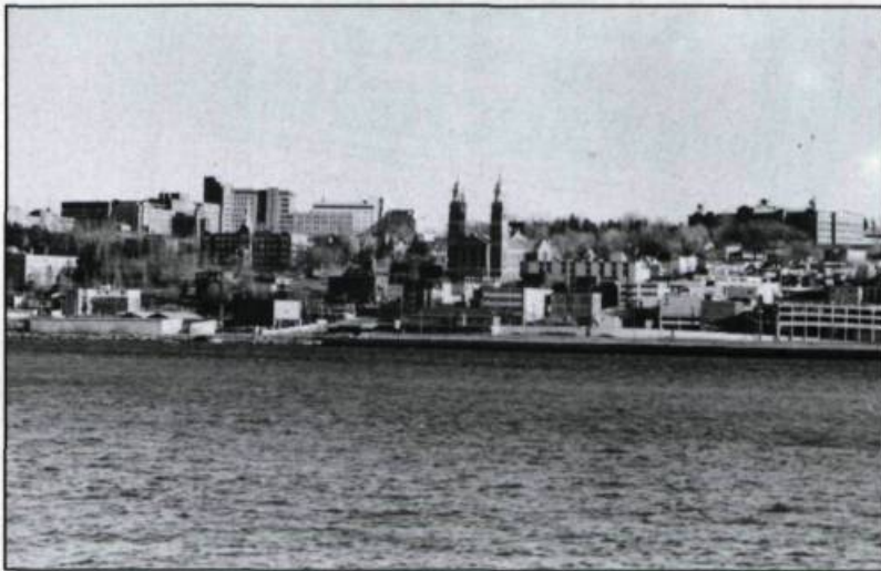
Le secteur historique de la ville de Chicoutimi en 1992.

à-bras qu'il a instauré dans le Haut-Saguenay. Cette justice expéditive a particulièrement bien servi le Métis dans les premières années, car elle l'a autorisé en quelque sorte à imposer son autorité incontestée, à établir son monopole commercial et à s'emparer des meilleures portions du territoire du canton. Pour toutes ces raisons, on comprend aisément les motifs qui expliquent l'ampleur et la persistance de cette polémique qui ne semble pas vouloir se régler... même après 150 ans d'histoire. ♦