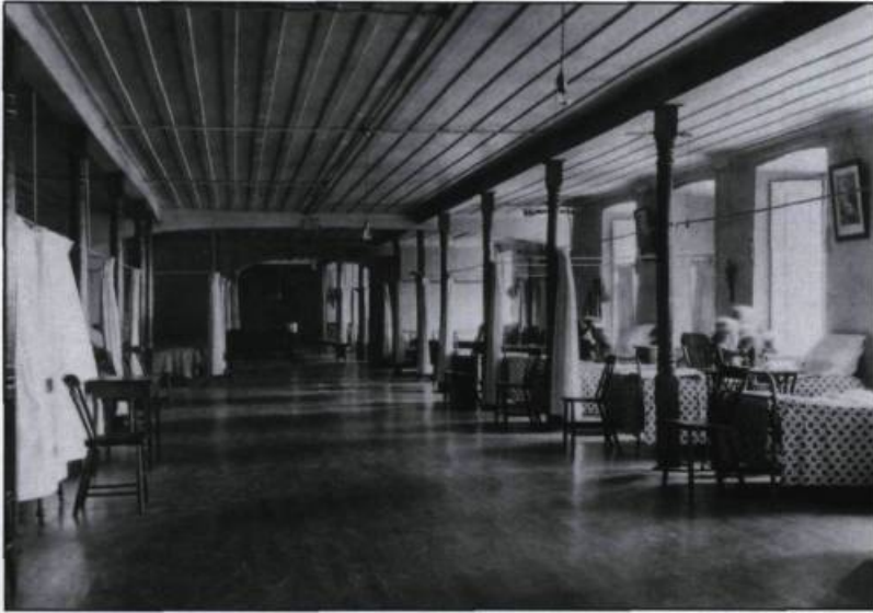
Cette photographie de R. Traquair (1928) montre la salle du premier étage de l'aile de la façade (1714-1950).