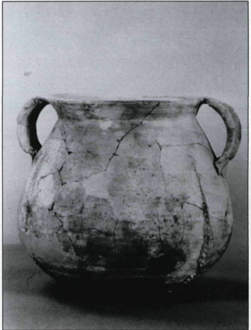
En retrait du four, une aire d'habitation est révélée par la présence de tessons de céramique européenne provenant principalement d'une petite marmite bulbeuse à pâte chamoise roussâtre, décorée de bandes verticales moletées de motifs géométriques, identique à celle-ci trouvée à Red Bay. (Photographie: Gérard Gusset, Service canadien des parcs).

Bordeaux font référence à ces grandes chaudières fabriquées avec du cuivre importé d'Allemagne ou de Suède. Il y avait vraisemblablement une plate-forme érigée à l'arrière du four comme c'est souvent le cas sur les sites basques de Red Bay. Cette plate-forme aurait facilité l'accès à la