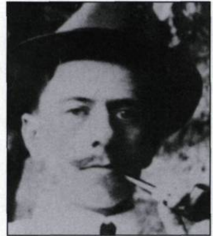
Louis Hémon (Brest, France, 1880 – Châteauguay, Ontario, 1913). Après des études en droit et en langues orientales en France, Hémon va vivre huit ans en Angleterre, puis vient s'établir au Canada.

livre s'est échelonnée de 1929 à 1933. Plusieurs imprimeurs se sont relayés pour créer une pièce digne des musées. L'édition de 1933 est plutôt rare au Québec puisqu'elle a été surtout diffusée en Europe. Il existe en circulation 100 exemplaires, numérotés de 1 à 100, sur papier blanc nacré du Japon. La même édition a également fait l'objet d'un tirage moins luxueux (1 900 exemplaires sur papier de Rives, numérotés de 101 à 2 000) et d'un tirage hors commerce de 80 exemplaires (10 sur papier nacré du Japon et 70 sur papier Rives).