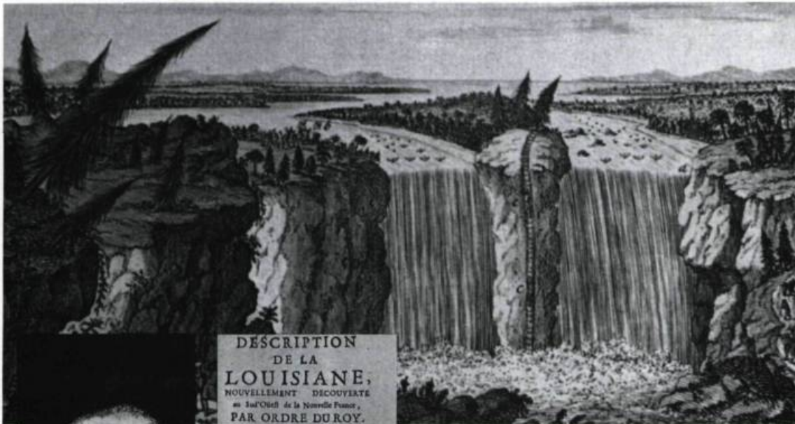
En 1679-1680, c'est un récollet, Louis Hennepin, qui accompagne Robert Cavelier de la Salle jusqu'au golfe du Mexique. L'un des premiers Européens à décrire les chutes du Niagara, Hennepin publie des récits de ses voyages en 1683 et en 1697.