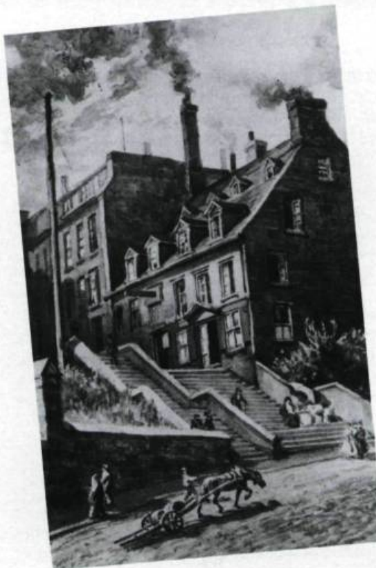
Le site du monument Laval tel qu'il apparaissait avant 1908. Une agglomération de maisons irrégulières occupait l'emplacement. (C.W. Jeffery, 1889.).

La cérémonie du dévoilement eut lieu le lendemain, 22 juin, à 15 heures. Une messe pontificale avait été célébrée le matin dans la chapelle du Séminaire. Les murs de l'hôtel des postes, du presbytère et de l'archevêché étaient ornés de drapeaux et d'inscriptions, alors que les abords du monument étaient ornés de verdure. Un chœur de 600 voix fut mis à contribution; il exécuta entre autres une Cantate en l'honneur de monseigneur de Laval d'après un texte d'Octave Crémazie. Après l'allocution du président du comité, L.P. Sirois, le gouverneur général du Canada, Lord Grey, procéda au dévoilement en présence d'une foule estimée à 50 000 personnes. François de Laval voyait ainsi son œuvre consacrée par l'histoire. ♦