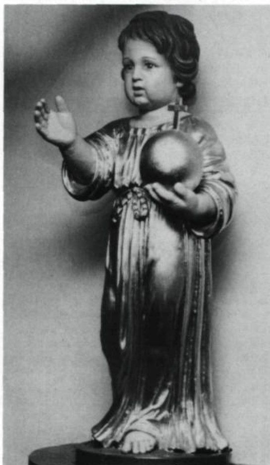
Chaque dimanche et jour de fête, les enfants exposent sur leur porte l'image de leur saint patron. (Bibliothèque nationale, Paris).

«Ce Séminaire a été institué pour honorer l'enfance de Jésus, retirer les enfants de la corruption du siècle, les conserver dans l'innocence et les disposer à l'état ecclésiastique ou à servir dans le Séminaire». «Règles communes du Séminaire De L'enfant Jésus».