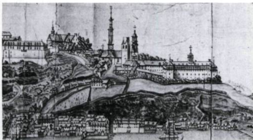
À l'origine logés dans l'ancienne maison de la veuve Couillard, les pensionnaires gagnent, au tournant des années 1670 et 1680, les nouveaux bâtiments du Petit et du Grand Séminaire. Sur ce cartouche d'une carte de Jean-Baptiste-Louis Franquelin, de 1688, apparaît du côté droit le Séminaire de Québec.

Le programme de formation du Petit Séminaire est tout entier défini par le modèle de prêtre que le Grand Séminaire entend former, c'est-à-dire exemplaire par ses mœurs, sa piété et son savoir. Il s'articule aussi à une vision du monde et de l'enfance, où l'enfant est perçu comme un être malléable, qu'on peut modeler comme une «cire molle» pour le préserver de la «corruption du siècle» vers laquelle il est naturellement porté.