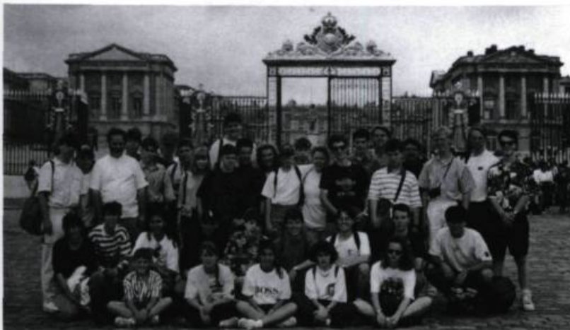
L'Orchestre d'harmonie senior, en voyage en France, pose devant la grille du château de Versailles. («L'Abeille», vol. 39, n° 2, automne-hiver 1993).

Les cuivres et les bois sont naturellement à l'honneur, pour alimenter la Société Sainte-Cécile. Gare aux oreilles sensibles, si l'on en juge par ce commentaire de Joseph-Edmond Roy, pensionnaire entre 1867 et 1877: La musique instrumentale, placée aux heures de récréation, est cultivée avec peut-être trop d'ardeur. C'est à dire que le Canadien, comme ses pères les Français, aime le bruit, surtout le bruit cadencé [...] .