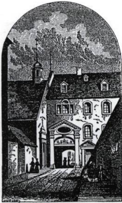
Porche de l'aile de la Congrégation vers 1858-1859. Du côté gauche, on voit la chapelle du séminaire construite en 1750-1752 et détruite par un incendie en 1888.