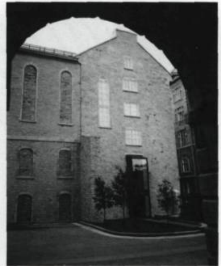
Pensionnat de l'université, puis couvent, l'édifice situé au 9, rue de l'Université abrite depuis 1984 le Musée du Séminaire de Québec et ses riches collections.