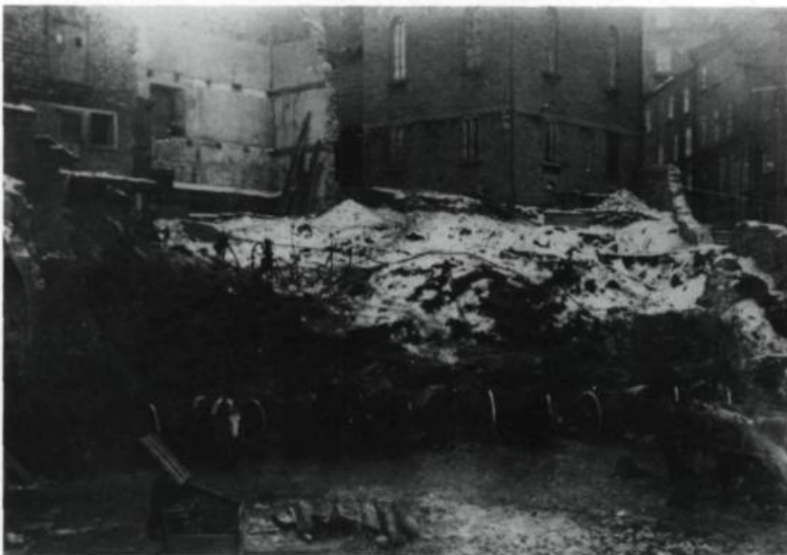
Débuts des travaux de construction du Pavillon des classes ou Maison neuve, sur la rue Sainte-Famille, vers octobre 1919. (Archives du Séminaire de Québec).

L'équipe de natation du Petit Séminaire reçoit pour la troisième année consécutive le trophée de la Fédération des activités sportives collégiales du Québec.