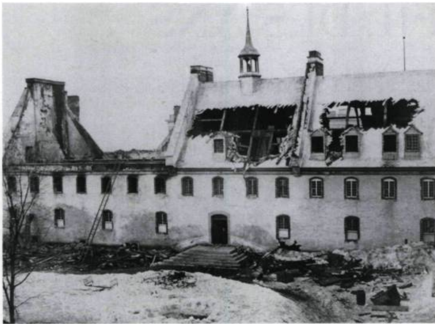
Le 25 mars 1865, un incendie détruit une partie importante de l'aile de la procure.