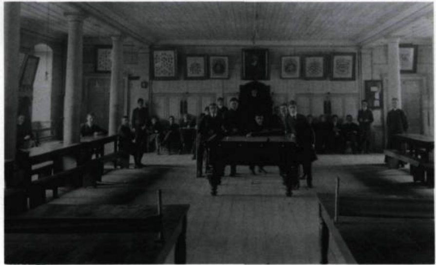
Salle de récréation des «Grands». Carte postale photographique, vers 1910. (Archives du Séminaire de Québec).

Le Petit Séminaire est constitué par lettres patentes en corporation distincte. Le conseil d'administration est composé de sept membres, tous des prêtres œuvrant au Petit Séminaire.