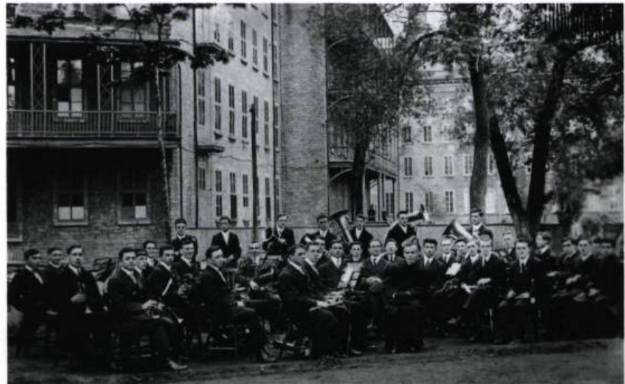
Fanfare du Petit Séminaire de Québec. (Académie Sainte-Cécile). Photo prise pendant l'année scolaire 1915-1916.