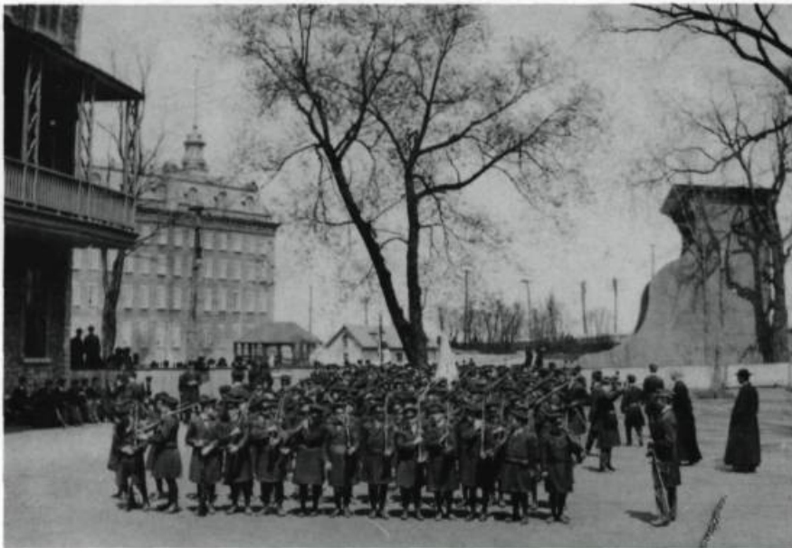
Démonstration des cadets du Petit Séminaire de Québec dans la cour des «Grands» vers 1915. (Collection Yves Beauregard).