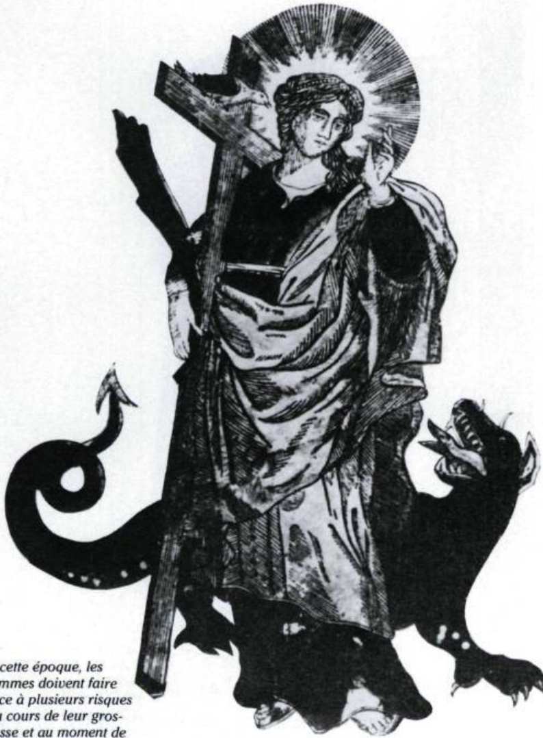
A cette époque, les femmes doivent faire face à plusieurs risques au cours de leur grossesse et au moment de leur accouchement. Plusieurs se placent alors sous la protection de Dieu et de ses saints, en particulier sainte Marguerite, patronne des femmes enceintes. (Bois gravé, début du XIX e siècle. Musée des Arts et Traditions populaires, Paris).

Le choix des parrain et marraine n'était pas non plus le fruit d'un hasard et avait lui aussi une profonde signification sociale. Choisir un parrain et une marraine est beaucoup plus qu'une marque