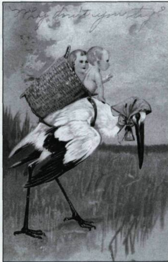
Dans le Québec traditionnel, tout ce qui touche la naissance reste un sujet tabou. On dira par exemple aux enfants que la cigogne est passée pour expliquer qu'ils ont un nouveau petit frère ou une nouvelle petite soeur. (Carte postale, vers 1908.).

La cérémonie du baptême qui fera de l'enfant un nouveau membre de la communauté paroissiale peut alors avoir lieu. Y assistent généralement le père, mais pas toujours au grand dam de l'Église qui ne manque pas d'exprimer alors son mécontentement, ainsi que les parrain et marraine. Quelquefois la famille fait appel à une personne autre qu'une parente pour porter l'enfant: la sage-femme, la fille engagée ou une femme qu'on veut honorer. Mais la présence de cette porteuse n'était pas de règle et dépendait surtout des familles et des villages. Par contre, le port par l'enfant d'un trousseau de baptême, toujours très beau, était de règle. Généralement fabriqué par la mère, la grand-mère ou une soeur de la mère pour la naissance du premier enfant de la famille, il servira par la suite aux autres enfants de la maison. Il arrivait quelquefois que ce trousseau soit transmis de la mère à sa ou ses filles, mais c'était souvent fonction de l'état des vêtements. Le trousseau de baptême avait donc une très forte signification familiale.