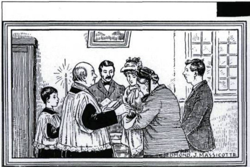
Le baptême. The Christening.