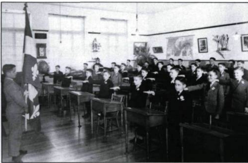
«Le serment au drapeau, 1950». Depuis l'ère du daguerréotype, les institutions scolaires, les orphelinats conservent de précieux clichés sur le passage de générations d'enfants, souvent indicatifs des valeurs d'une époque.