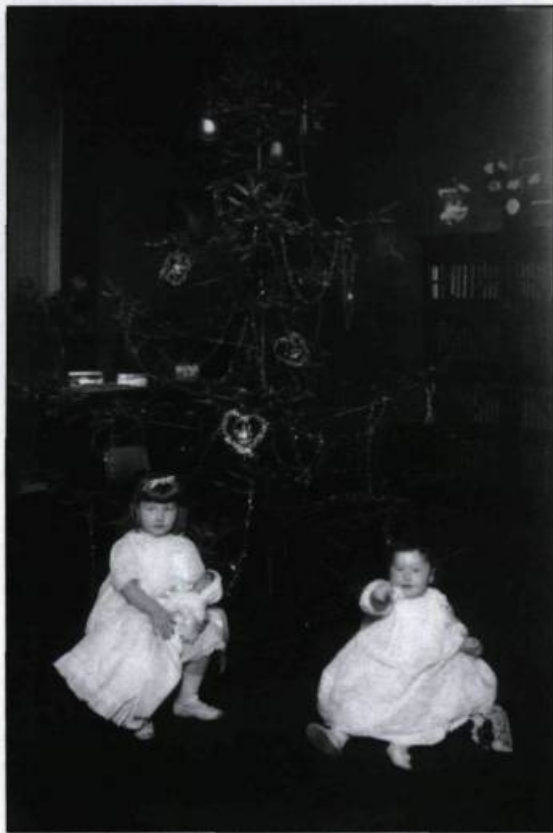
«Les enfants de Lotbinière, 1915». Au xx e siècle, la souplesse des équipements permet au photographe professionnel de se déplacer à la maison pour fixer les familles. Fêtes et anniversaires sont des temps forts pour croquer la progéniture.

traduite dans le choix de l'artiste, dans l'aménagement de l'image, dans le vêtement et l'activité des jeunes sujets. Ainsi, tout un monde sépare la jeune demoiselle dans ses plus beaux atours, tirée par Notman dans un décor de salon somptueux, du portrait sur ferrotipe d'un photographe de quartier ou de village montrant une fillette avec son balai. Ce format est alors le plus commun. L'attitude, le costume, le geste et la mise en scène marquent déjà dès le tout jeune âge les rôles de pouvoir et de servitude vécus