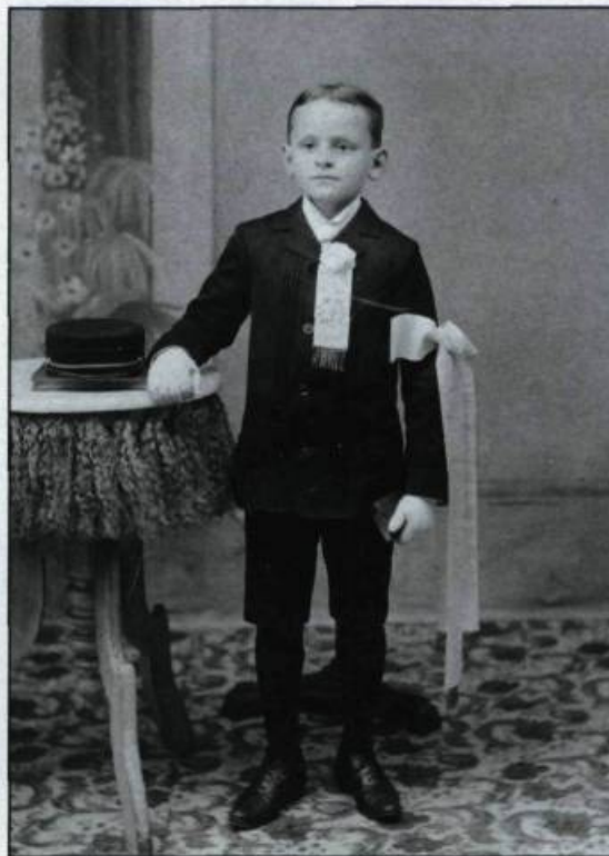
«Les communiant». La majorité des portraits consacrés à l'enfance fixent un rituel de passage, de la naissance à la mort en passant par les anniversaires de naissance et la première communion. Le chapeau dans l'image marque symboliquement la transition à l'âge adulte, à l'âge de raison. (Photos de D. Léonard, Montréal et J. Bélanger, Saint-Jérôme. Collection privée).