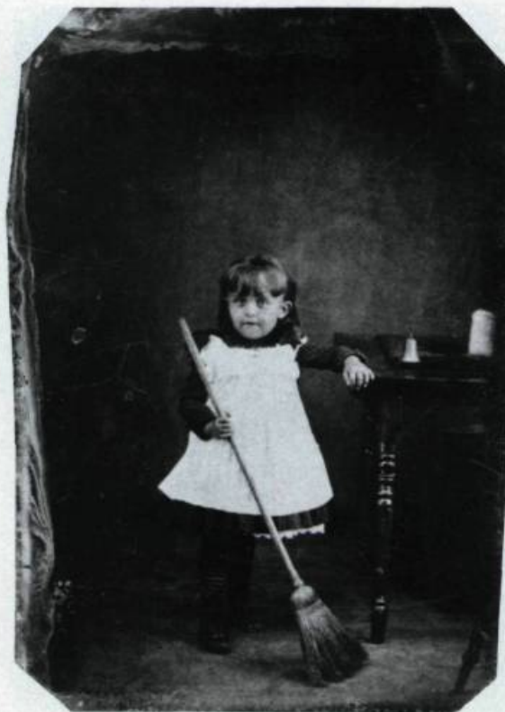
«Enfant au balai, vers 1880». Le portrait d'enfant inscrit le sujet dans un registre de classe sociale.

Le regard sophistiqué de studio sur les enfants en est toujours un académique et officiel, un peu guindé, bien inscrit dans les courants esthé-