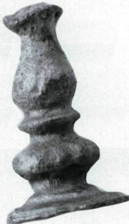
Pièce d'échecs en alliage d'argent venant de l'Abitation de Champlain, début du XVII e siècle. (Ministère des Affaires culturelles. Photographie: Brigitte Ostiguy).

Les jeux de dames sont présents au Canada dès le Régime français. Le sieur de Lamotte, résidant sur la rue Notre-Dame à Montréal, possède en 1700: un Jeu de Dame dont treize dyvoire et treize de bois Noirssy avec son sac . Dans les collections archéologiques, les objets reliés au jeu de dames restent rares puisque les pions étaient souvent en bois.