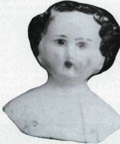
Tête de poupée en porcelaine.

La collection de Place-Royale représente bien les poupées en usage au XIX e siècle: elle comprend une tête et trois jambes en porcelaine, probablement d'origine anglaise. La tête est ornée d'une chevelure moulée et peinte. Quatre points d'ancrage permettent de fixer le buste au corps de chiffon. Une jambe comporte aussi un petit trou de fixation.