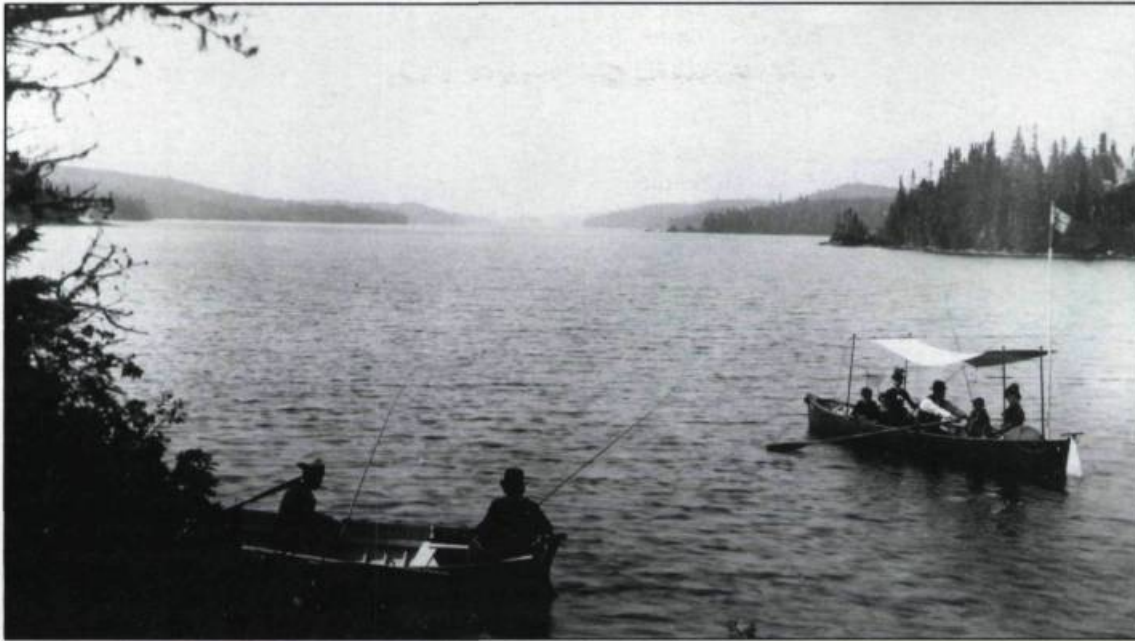
«Pêche au lac Édouard en 1889». Plusieurs stations estivales forestières exploitent les plaisirs de la pêche à la ligne ou à la mouche. Certains lacs comme le lac Édouard sont accessibles à toute la famille. Pendant que les hommes taquinent la truite, femmes et enfants font des tours dans un bateau abrité du soleil.

rizon lointain, vague comme leur pensée; elles cherchent l'image de leur âme sur la surface de l'onde éternellement ondoyante et changeante; les parfums de la mer dilatent leur poitrine émue; ça et là des enfants courent en ramassant des coquilles et s'ébaudissent dans les flaques d'eau abandonnées par le reflux...».