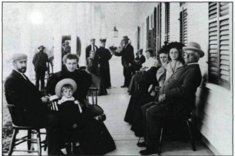
«Vie de galerie à l'Hôtel Tadoussac, vers 1864». La contemplation et la conversation «aimable» sur la véranda font partie des grands loisirs de la villégiature.

Le chroniqueur s'intéresse aussi aux activités des villégiateurs. Les repas sont fréquents et, dans les hôtels les plus huppés, on mange toujours au son de la musique: «L'habitant du Saint-Lawrence Hall (Cacouna) est un dieu et il n'a pas le temps d'avoir un désir. Pour égayer les repas et faciliter la digestion troublée par le surcroît d'appétit qu'apporte l'air vif de la campagne, des musiciens loués pour la saison font entendre les sons de la harpe, du violon et de la flûte, et cela