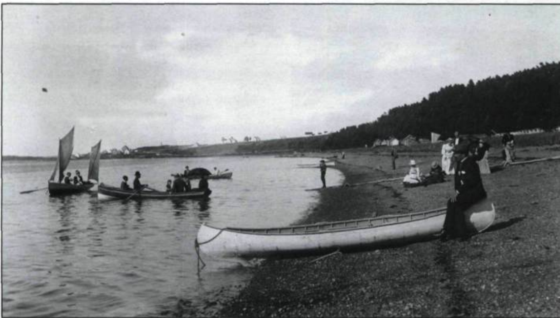
«Sur la plage à Cacouna en 1890». Parmi les plaisirs de la plage, les estivants ont le choix entre la baignade, la promenade en bateau, le canotage ou plus simplement la contemplation et le grand air.