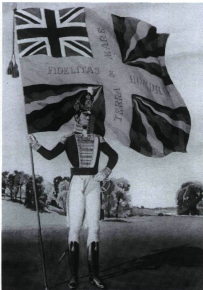
«Enseigne du régiment de Meuron avec le drapeau d'ordonnance, 1806». En service au Canada en 1812-1813, plusieurs des soldats du régiment de Meuron décidèrent de se fixer au pays.

Dans une moindre mesure, on trouve dans ce groupe des réfugiés originaires de France et qui sont passés en Amérique à la suite de la révocation de l'Édit de Nantes en 1685. Au XVIII e siècle, on signale également des prisonniers de guerre qui, à la suite de leur captivité, ont décidé de demeurer au pays. De ces 455 individus signalés dans les registres de l'état civil du Québec