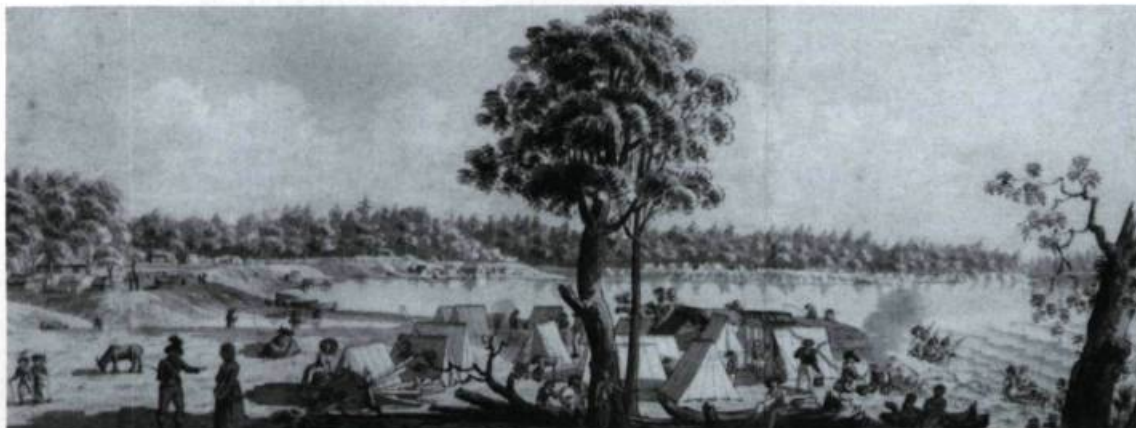
«Campement de Loyalistes sur les rives du Saint-Laurent en 1784». À la suite de la guerre d'indépendance américaine, plusieurs milliers de personnes désirant rester fidèles à l'Angleterre, les Loyalistes, viennent s'établir dans la «Province of Quebec». Aquarelle de James Peachy.

Dans Les Européens au Canada des origines à 1765 , j'ai signalé la présence au pays de 928 individus qui avaient pour origine un pays européen autre que la France. Parmi ces individus