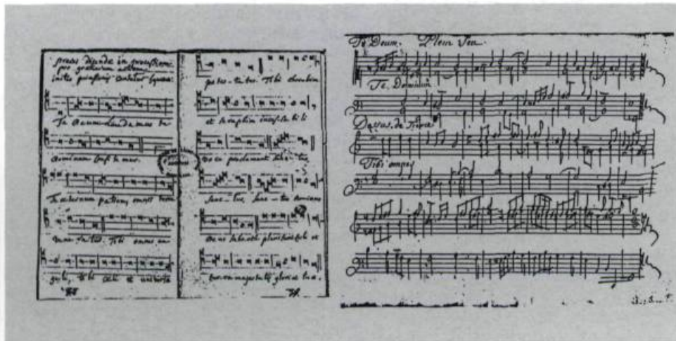
«Te Deum» tiré d'un recueil d'hymnes..