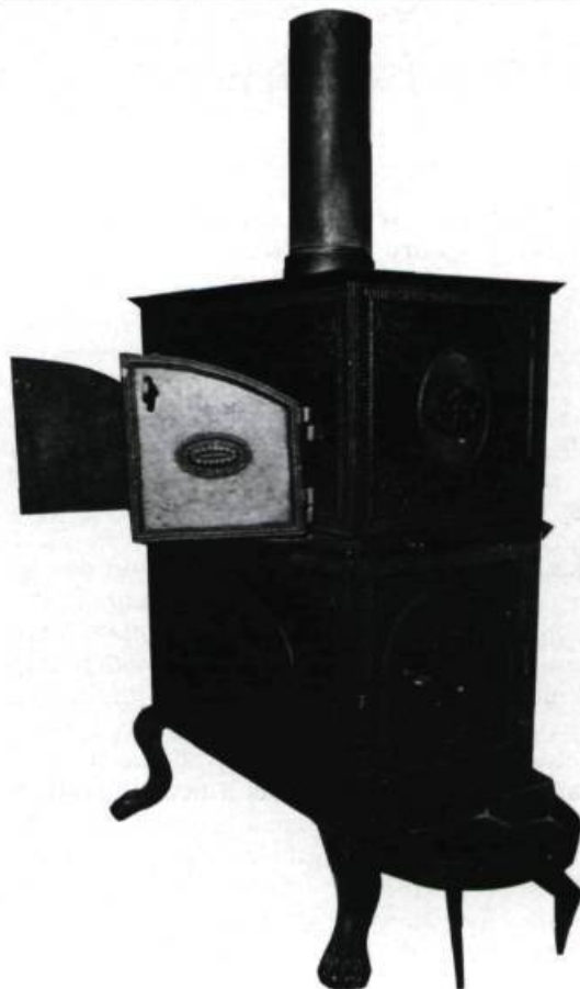
Poêle en fonte à deux ponts fabriqué aux forges du Saint-Maurice.