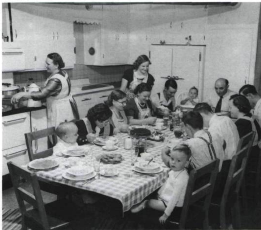
Repas familial dans la cuisine à la fin de la décennie 1950. À cette époque le poêle à bois, Bélanger ou L'Islet, occupe encore une place prépondérante.

siècle, en milieu urbain, à l'invention et à l'adoption de systèmes centraux de chauffage utilisant un combustible traditionnel comme le bois ou encore le charbon et puis le gaz. Avec l'aménagement du chauffage central, nous assistons à celui de l'organisation de la maison moderne telle que nous la connaissons. Nous assistons aussi au divorce entre les feux servant au chauffage et ceux servant à la cuisson des aliments. C'est cette séparation qui rendra possible, dès le début du siècle, la prolifération de ces cuisinières électriques, peu efficaces pour le chauf-