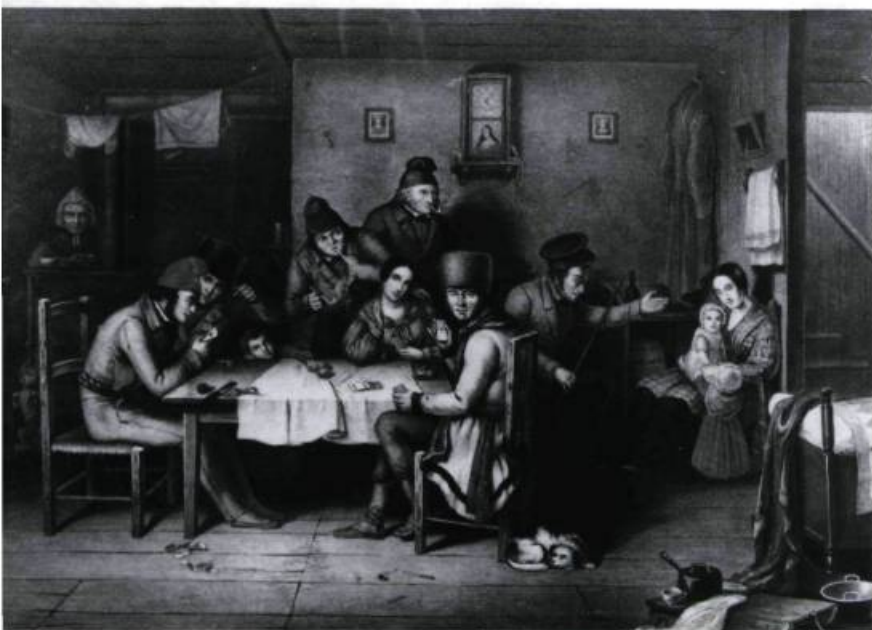
Canadiens dans la salle commune chauffée par un poêle à deux ponts à l'arrière-plan. Peinture de Cornelius Krieghoff, vers 1848. (Archives nationales du Canada, C-57).

représentés par seulement quelques fragments de leurs parois. Mais on peut supposer, comme nous le rapportent les documents écrits de cette époque, que cet âtre était aussi équipé d'une broche à rôtir, d'une potence pour suspendre marmites et chaudières, de trépieds sur lesquels déposer les récipients à cuire au-dessus des braises, sans oublier tous les accessoires servant au chauffage comme les chenets, le tisonnier, la pelle à feu, les tenailles et le soufflet. Certaines cheminées comportaient aussi un four dans lequel on faisait cuire le pain.