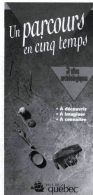
William Moss et Henriette Thériault (dir). Un parcours en cinq temps . Québec: Ville de Québec, Bureau des arts et de la culture, Service de l'urbanisme en collaboration avec le Service des communications et des relations extérieures, 1993, 37 p.

Résultat d'une action concertée de dix-huit musées et centres d'interprétation de Québec, la publication propose 33 sorties éducatives pour le primaire et le secondaire, choisies en fonction de la thématique: Québec, ville mémoire. Admirablement bien conçu, c'est un outil de planification de premier ordre pour les activités pédagogiques. La publication de la brochure a été rendue possible grâce à la participation financière du ministère de la Culture, du ministère de l'Éducation et de la Ville de Québec. C.L.