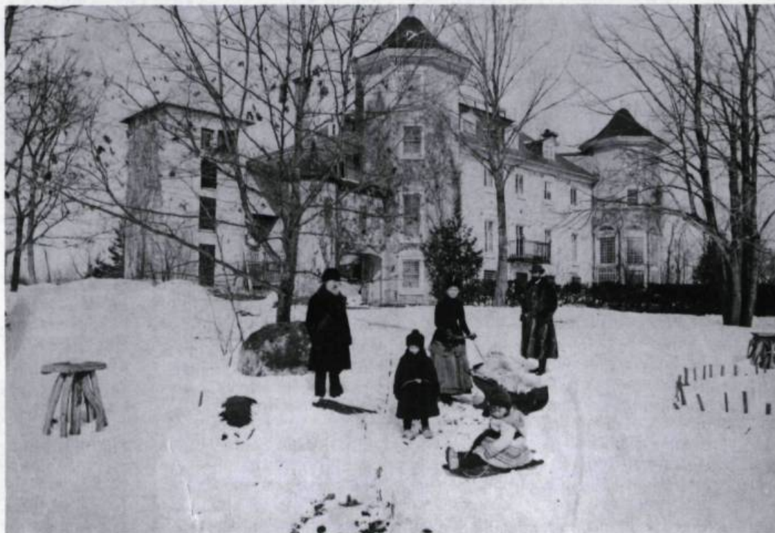
Le manoir à l'angle sud-ouest, vers 1885. Au premier plan se dresse la petite tour des latrines reliée à la tour octogonale de l'escalier à vis. À l'extrême gauche: la tour carrée de la bibliothèque.