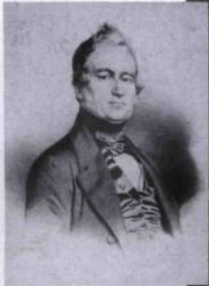
Louis-Joseph Papineau, vers 1843. Lithographie de Maurin.