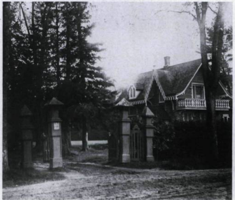
Le portail d'entrée du domaine avec en arrière-plan la maison du jardinier. Vers 1915. (Archives nationales du Canada).

de la tour avait la forme d'un parapet crénelé émergeant au-dessus d'un auvent et dissimulant au regard la toiture surbaissée, première manière. Ce détail architectural qui nous introduit à la recherche de l'effet pittoresque de l'époque Regency, où l'éclectisme est de bon aloi, rappelle que Papineau s'était interrogé sur l'allure générale de son manoir. Le sommet du carré ainsi que le couronnement des tours allaient-ils être crénelés suivant une tangente néo-gothique? On sait la voie qu'il choisit fina-