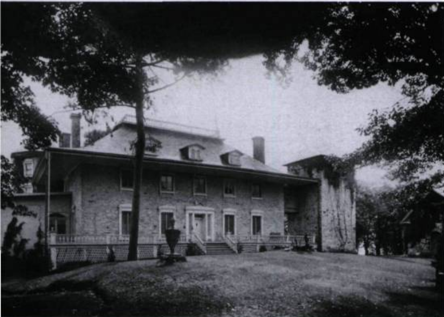
La façade nord du manoir, vers 1929. Vers la gauche se profile le salon hors-cœuvre de 1881; à l'opposé on voit la tour carrée de la bibliothèque. À l'extrême droite: la façade du musée familial édifé en 1880.

Le domaine dans son ensemble comprenait plusieurs édifices. Il y avait une chapelle funéraire en pierre édifée en 1853-1854 d'après le vocabulaire néo-gothique. Le même style inspira la construction de la maison du jardinier en 1855, un édifice tout en brique. On peut en dire autant de la «grainerie» dont un des pignons est surmonté d'un pigeonnier. Sa construction remontait à 1855, mais un incendie le ravagea et l'on procéda à une reconstruction en 1860. C'est à l'étage de cet édifice que Napoléon Bourassa, le gendre de Louis-Joseph Papineau, avait installé son atelier de peinture. Le plafond à pans conserve encore des fresques exécutées par Bourassa. Au sud du manoir, s'élevait une construction largement vitrée qui servit peut-être de pavillon de bain avant d'être connu comme pavillon de thé au début du xx e siècle. En outre, on trouvait plusieurs bâtiments de type agricole: une grange, une étable jumelée à une écurie, une porcherie, un poulailler, une remise pour les voitures jouxtant une glacière, et une remise pour le bois. Tout cela, c'était sans tenir compte d'un abri pour un élevage de chevreuils et d'une cabane à sucre.