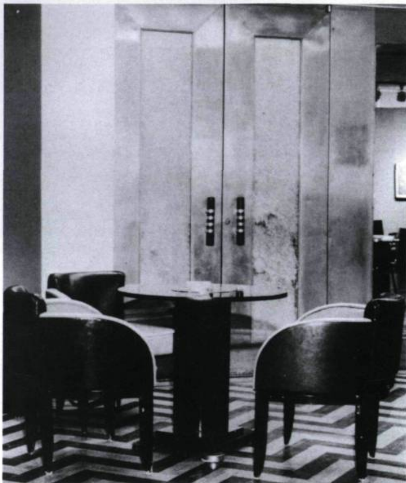
Fumoir de la salle à manger du restaurant le 9 e chez Eaton en 1976.

l'on trouvait sur les paquebots de croisière de l'entre-deux-guerres. À cette fin, l'architecte Jacques Carlu s'est inspiré de la salle à manger de l' Île-de-France , lancé par la compagnie française French Line en 1927. Le trait d'union entre