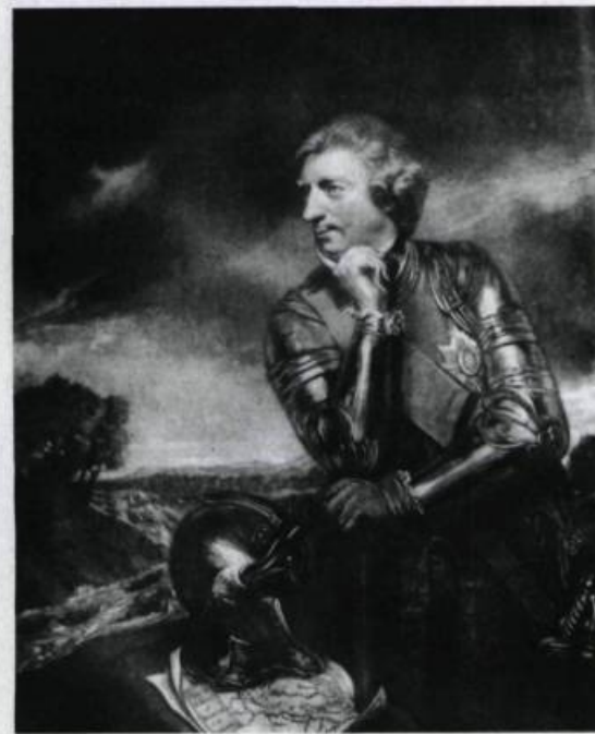
Sir Jeffery Amherst (1717-1797). Commandant en chef des forces britanniques en Amérique en 1758, il avait pour mission d'attaquer les Français. Il capture Louisbourg, Carillon, Pointe-à-la-Chevelure, puis marche sur Montréal qu'il oblige à capituler et complète ainsi la conquête de la Nouvelle-France. Gravure d'après une peinture de Joshua Reynolds.

jecte. Il ordonne même à Johnson de les empêcher d'aller cueillir leur part du butin. Frustrés, «506 des 691 guerriers indiens», décident de quitter les troupes d'Amherst non sans avoir ramassé quelques scalps.