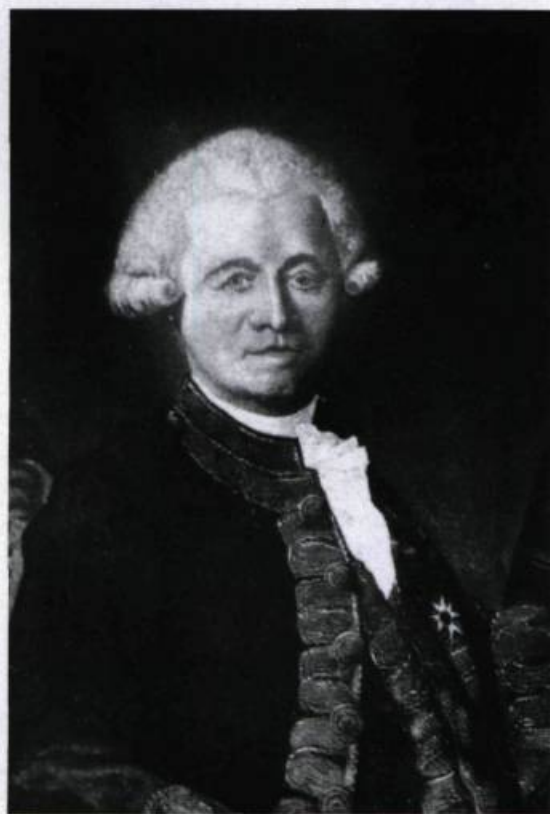
Jean-Daniel Dumas (1721-1792). Arrivé au Canada en 1750; vainqueur de Braddock lors de la bataille de la Monongahéla (1755). Il commande l'aile droite de l'armée franco-canadienne à la bataille des plaines d'Abraham (1759), il fut blessé à la bataille de Sainte-Foy (1760).

Le célèbre officier français, alors aide de camp de Montcalm, trouve bien des défauts aux Indiens, mais il les juge indispensables. «C'est l'affection qu'ils [les Indiens] nous portent, admet-il, qui jusqu'à présent, a conservé le Canada.» Aussi s'inquiète-t-il lorsqu'il constate, en avril 1758, qu'il «n'est venu qu'un parti des Sauvages, preuve de leur refroidissement, puisque l'année dernière il y en avait toutes les semaines».