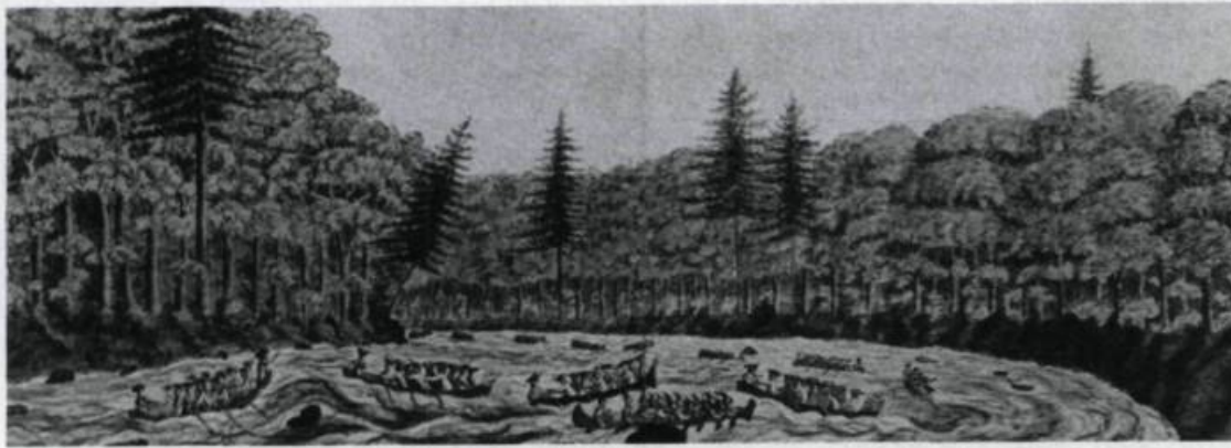
À la fin d'août 1760, les troupes du major général Amherst doivent franchir les rapides du fleuve Saint-Laurent avant de parvenir à Montréal. Illustration de Thomas Davies, 1760. (Archives nationales du Canada).