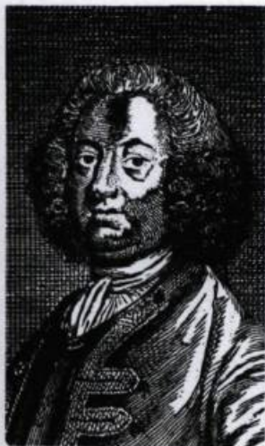
William Johnson (1715-1774). Arrivé en Nouvelle-Angleterre en 1734, il fut nommé commissaire des Six-Nations iroquoises qu'il sut habilement gagner à la cause des Anglais contre les Français pendant la guerre de Sept Ans. Il remporta plusieurs victoires avant et après l'invasion du Canada sous Amherst. (Gravure tirée du «London Magazine»).

niers comprirent ce qui se tramait. Il y avait en effet plusieurs «petits William Johnson» chez les Canadiens et parfois chez les Français. Pierre Pouchot, dernier commandant du fort Lévis sur le Saint-Laurent, sera un de ceux-là.