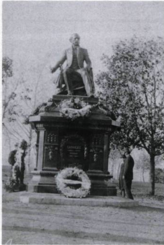
Offert au Gouvernement du Québec en 1912 par Georges-Élie Amyot, industriel et conseiller législatif, le monument Garneau est l'œuvre du sculpteur français Paul Chevré. Il se trouve devant l'Hôtel du Parlement près de la porte Saint-Louis. Photographie anonyme, 1912. (Coll. Yves Beauregard).

est probable à voir la tournure lente, mais inévitable peut-être, que prennent les choses dans notre pays, que ce soit le dernier, comme c'est le premier ouvrage historique français écrit dans l'esprit et du point de vue prononcé qu'on y remarque, car je pense que peu d'hommes seront tentés après moi de se sacrifier pour suivre mes traces (...). Je veux entreprendre cette nationalité d'un caractère qui la fasse respecter à l'avenir.»