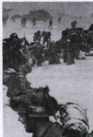
le ministère de la Défense nationale, trois intéressants vidéogrammes sur la terrible tragédie de Dieppe et le débarquement de Normandie. (Cap Inc., 650, Graham-Bell, # 204, Sainte-Foy, Qc G1N 4H5) ♦

Il y a 50 ans prenait fin la Seconde Guerre mondiale. De 1942 à 1945, les soldats canadiens et québécois avaient joué un rôle important dans la libération de l'Europe. Jacques Teyssier a réalisé à ce sujet, pour