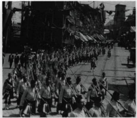
Plusieurs milliers de soldats canadiens participent aux différentes activités du tricentenaire de Québec. Par exemple dans la grande parade militaire les spectateurs purent voir des représentants du Treizième Dragoon Regiment (Waterloo, Québec); Toronto Highlanders; du 43 e régiment (Ottawa); de l'infanterie de la province de Québec etc.