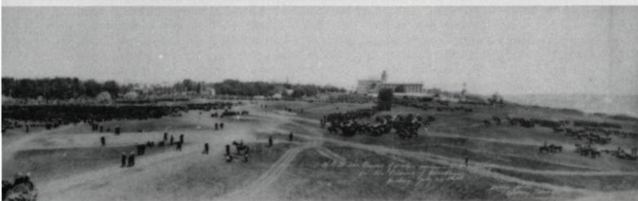
De son pavillon (au centre en arrière-plan) sur les plaines d'Abraham, le prince de Galles observe le défilé de la milice canadienne. (Musée canadien de la guerre).

pes rivales à leur arrivée sur le terrain. Pendant ce temps, sur le fleuve, l'escadron de la Manche de la marine royale, accompagné d'un cuirassé américain et de croiseurs français, «tirait des salves aux moments appropriés du spectacle et faisait brûler des feux d'artifice le soir». Le défilé militaire sur les plaines réunissait, non seulement la milice canadienne, mais aussi des contingents de marins britanniques, français et américains, de même que des membres de la «police à cheval du Nord-Ouest».