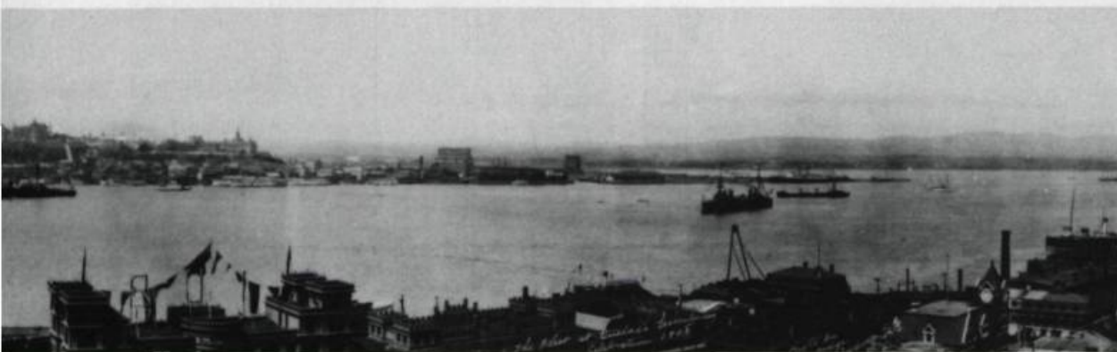
Les flottes britanniques, américaines et françaises mouillant dans le Saint-Laurent, à la hauteur de Québec.

BRATIONS DU TRICENTENAIRE DE QUÉBEC EN 1908