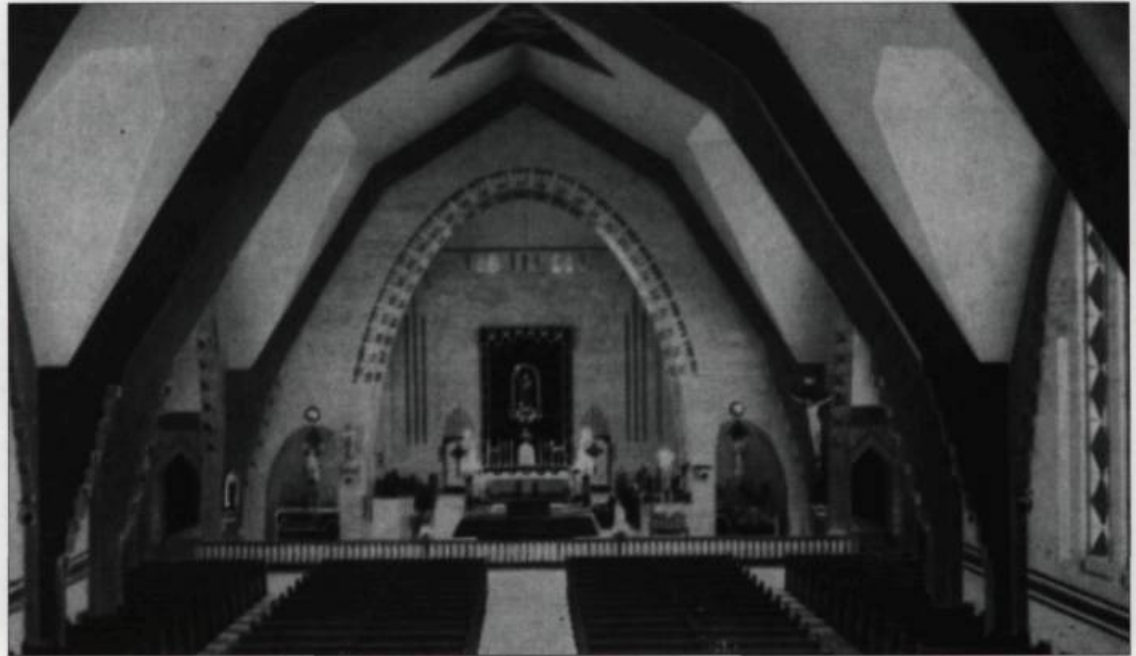
Intérieur de l'église de Saint-Pascal-de-Maizerets. Carte postale de Lorenzo Audet vers 1955. (Collection Yves Beauregard).

Les propos tenus par l'élite cléricale dans les journaux de Québec, aux différentes étapes de construction de l'église de la paroisse Saint-François-d'Assise, nous apparaissent révélateurs