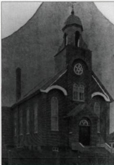
Église de Saint-Zéphirin-de-Stadacona. (Archives de la Ville de Québec; collection iconographique, N-010680).

transept. En effet, le chœur surélevé, mis en évidence dans le film d'Alfred Hitchcock La loi du silence en 1953, a été réalisé selon les plans de l'architecte Adalbert Trudel entre 1917 et 1918.