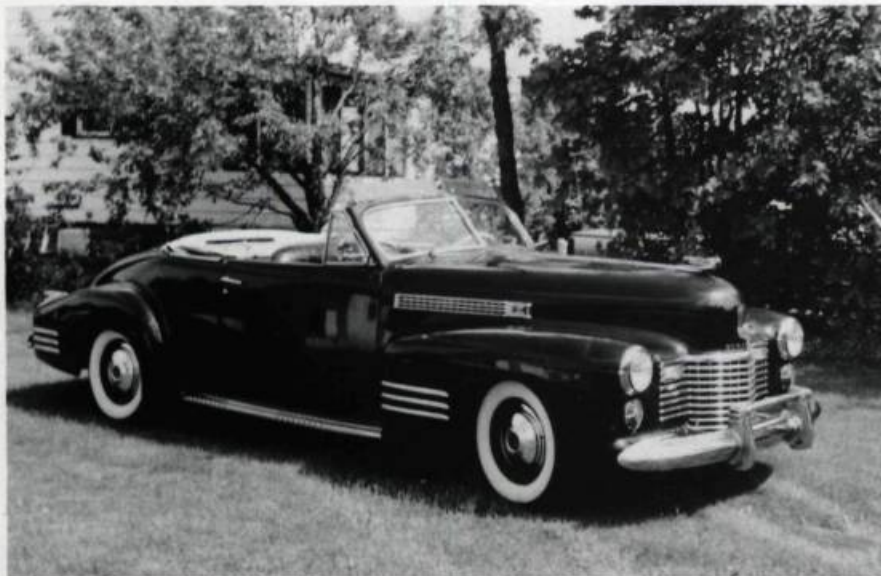
Cadillac 1941 (décapotable). Il n'existe que 60 exemplaires de ce modèle. Ce dernier a été acheté en Californie.

à peu, j'ai acquis de l'expérience par la pratique et je me suis documenté à l'aide de revues spécialisées, de certains volumes et de catalogues anciens.