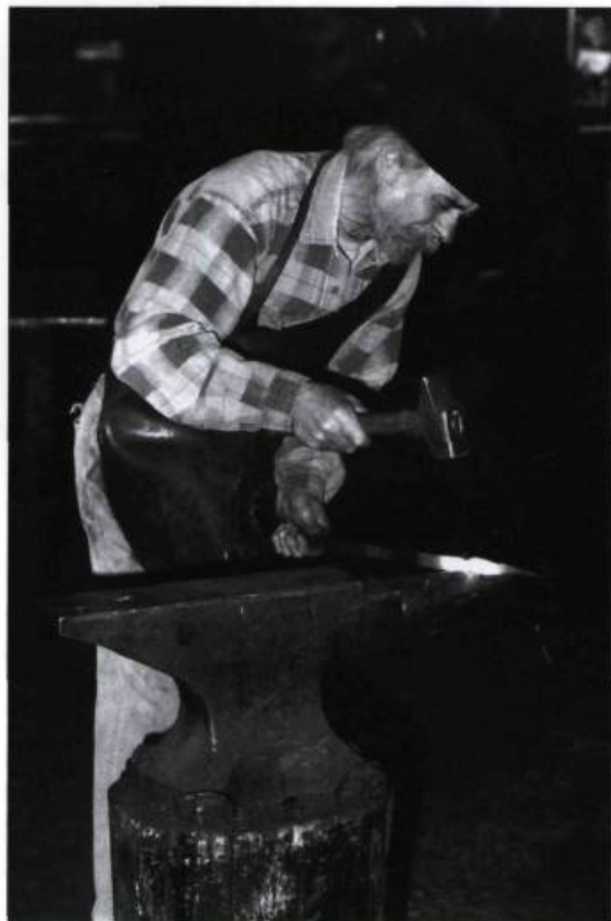
Économusée de la forge. Photo : Jean-Pierre Vachon, 1996. (Archives de la Fondation des économusées).

A u Québec et dans la plupart des pays industrialisés, la perte des savoir-faire traditionnels s'est faite de façon régulière et rapide depuis la Deuxième Guerre mondiale. Moins spectaculaire que la destruction de bâtiments, la disparition de ces métiers et de ces techniques ne se fait pas toujours sentir de façon immédiate.