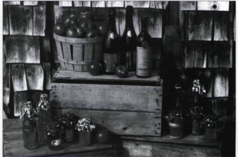
Économusée de la pomme. Photo : Jean-Pierre Vachon, 1996. (Archives de la Fondation des économusées).

Généralement, dès son entrée, le visiteur voit déjà l'atelier et les artisans qui s'activent : c'est le cœur de l'économusée. Le gros de sa visite se passera à cet endroit. Sur son parcours pour aller à la boutique, des espaces seront réservés à la présentation d'informations et d'objets anciens démontrant l'évolution historique du métier ou de pièces contemporaines illustrant les pratiques actuelles. Pour ceux qui sont avides