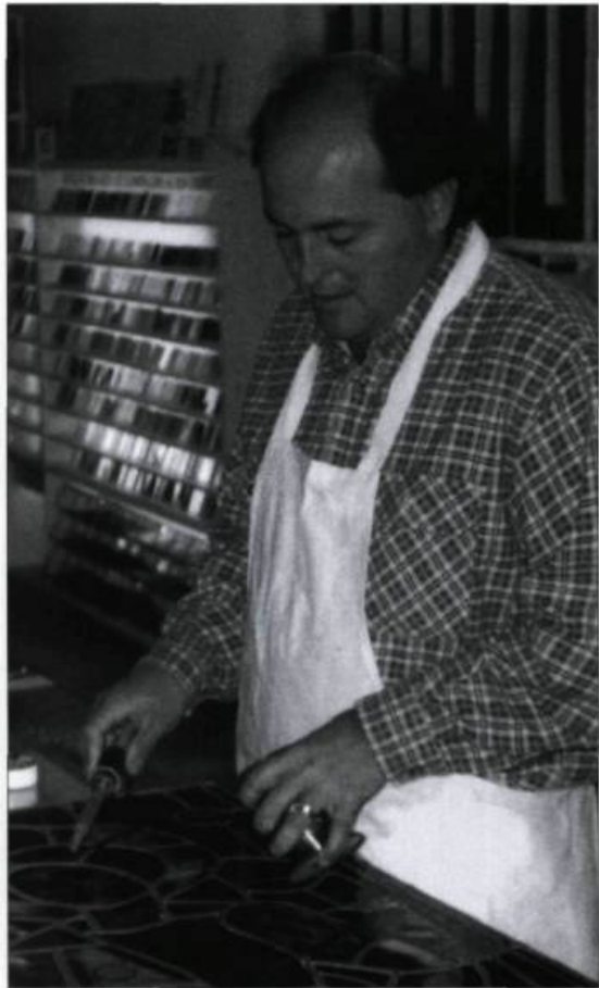
Économusée du vitrail.

d'économusée fait actuellement ses preuves. Le réseau compte 24 entreprises réparties dans huit régions du Québec — et une au Nouveau-Brunswick — et constitue un circuit touristique de plus en plus apprécié des visiteurs. La Fondation des économusées développe et gère le réseau en sélectionnant les projets, en fournissant aux entreprises l'expertise nécessaire à leur transformation et en faisant la promotion du circuit auprès des agences touristiques et du public.