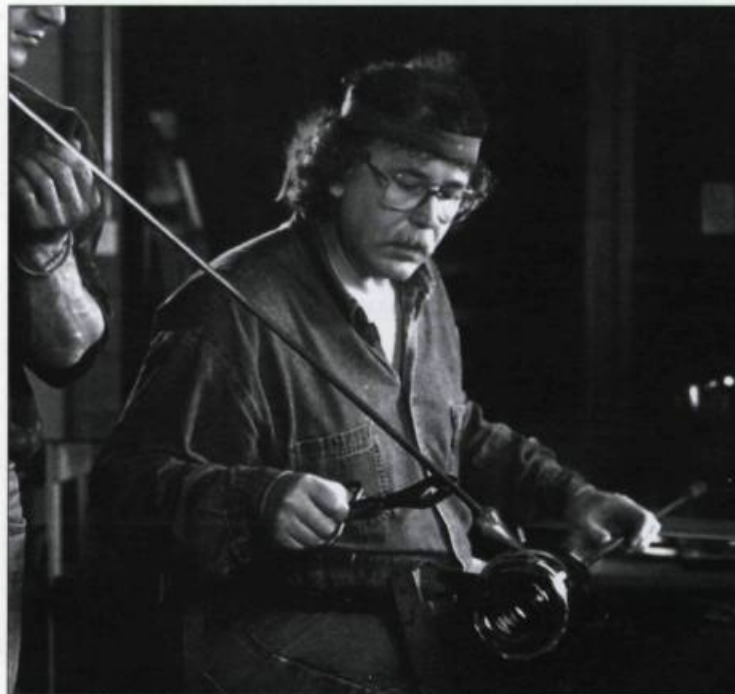
Économusée du verre.

d'informations, un lieu plus intime leur permettra d'avoir accès à une documentation pertinente. Le tout se termine par la boutique où le visiteur peut se procurer un souvenir de son passage ou un article qu'il sait maintenant apprécier.