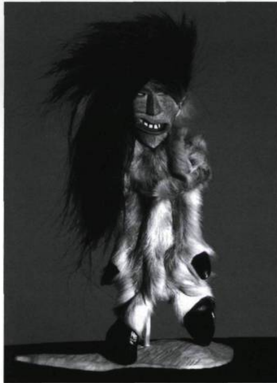
«Esprit du caribou», œuvre de Louis-Gabriel Jourdain. (Collection de l'auteur).

rituels qui accompagnaient sa mort et sa consommation. L'ours se trouve d'ailleurs au cœur de la spiritualité de tous les peuples autochtones et la tradition orale, dans ses mythes, ses légendes, ses récits, ses chansons, en parle abondamment. L'ours est incontestablement