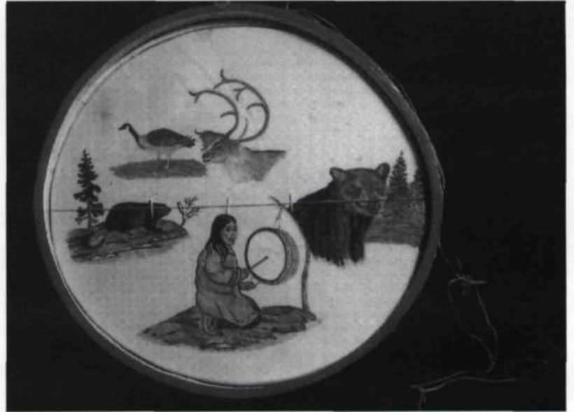
«Tambour innu». En utilisant cet instrument, le chasseur entre en communication avec l'esprit des animaux. (Collection privée).

les domaines de l'alimentation, de la langue, de la médecine, des vêtements, du sport, de la vie au grand air, de l'environnement, etc. Cependant, leur relation hautement spirituelle avec la nature et la place qu'elle y tient constitue un vaste champ d'études encore malheureusement trop timidement exploré. Un terrain pour ainsi dire vierge dont nous ne faisons que commencer à