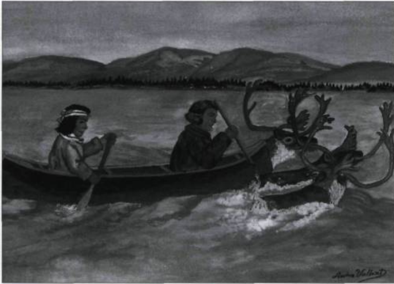
«Chasse aux caribous» par André Vollant, artiste montagnais. (Collection privée).

De tous les temps, la relation intime de l'Amérindien et de l'ours a étonné les explorateurs, les commerçants, les missionnaires et les anthropologues. La plupart de ces ethnologues de la première heure se sont arrêtés au cas de l'ours, probablement à cause des aspects mystérieux des