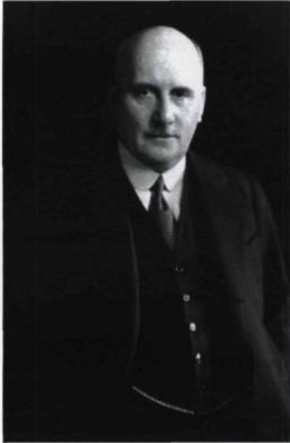
Le sénateur Lorne C. Webster souhaitait la sauvegarde de l'ancienne église Wesley. (Archives de L'Institut Canadien).

telle salle. L'absence d'arrière-scène limitait considérablement les possibilités de représentations. Le nouveau plancher de béton suit l'inclinaison originale de l'ancienne église. Il aurait fallu une déclivité plus importante pour assurer une bonne visibilité. L'étroitesse du vestibule de l'ancienne église convient difficilement