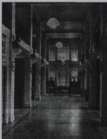
Vue de la bibliothèque de L'Institut Canadien alors qu'elle logeait au Palais Montcalm de 1932 à 1944.

À compter de 1950, avec l'ouverture des succursales ou bibliothèques de quartier, le personnel de L'Institut se multiplia et se spécialisa. En 1964, afin de superviser les activités de L'Institut qui prenaient de l'ampleur, un premier directeur général entra en fonction, Roland Nadeau. Au cours des ans, des spécialistes en bibliothéconomie, en animation, en relations publiques et en administration se joignirent à la grande équipe de L'Institut Canadien et du réseau de la Bibliothèque de Québec. ♦