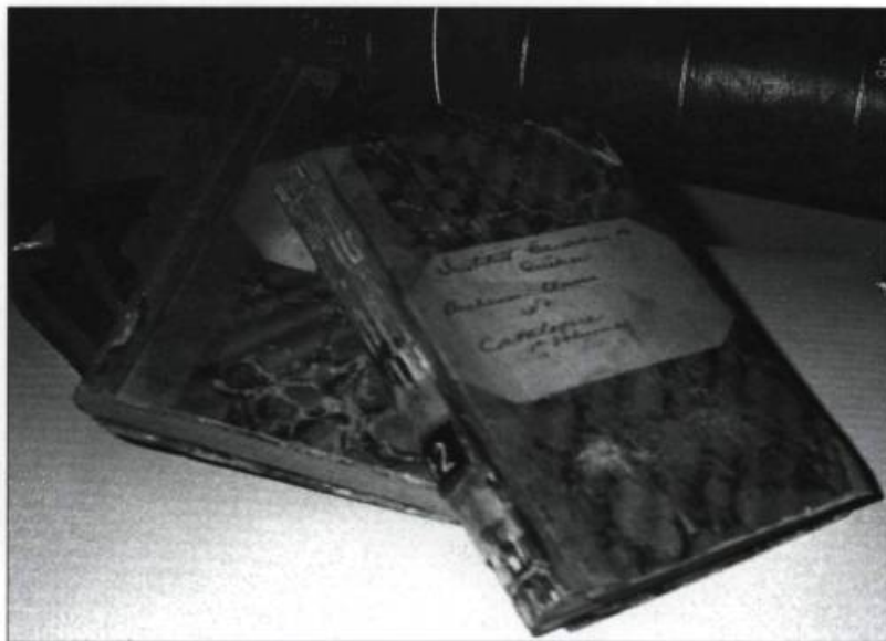
Les quatre volumes du catalogue manuscrit de la bibliothèque de L'Institut réalisé en 1848.

depuis 1890, qui réalisa cette publication rassemblant les titres de 6 000 volumes. Deux suppléments s'ajoutèrent en 1903 et en 1906, car la bibliothèque s'accroissait à cette époque de près de 1 000 volumes par année.