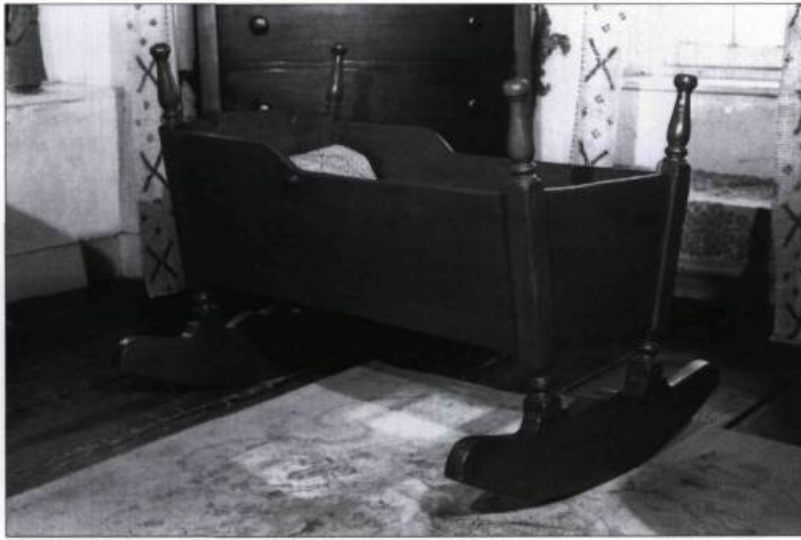
Berceau à quenouilles, à chevet et patins chantournés, XIX e siècle.

autobiographiques rédigées à l'intention de son fils Paul-Louis, il ajoute : «Les travaux de restauration du Manoir furent faits sous la direction de l'architecte Lorenzo Auger et une fois les réparations finies, je m'appliquai à meubler la maison avec des meubles antiques que je recueillis spécialement dans l'île d'Orléans et au Manoir de Berthier.»