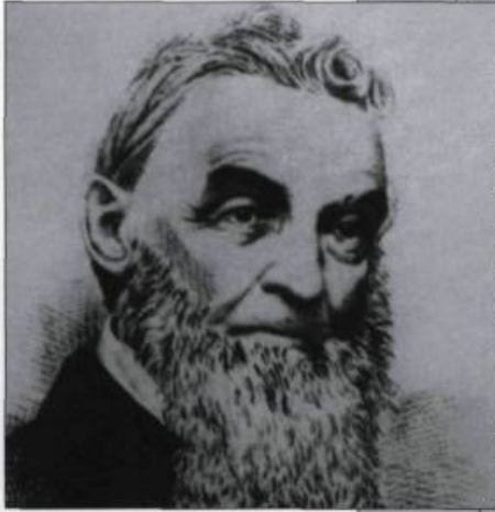
Robert Nelson (1792-1873). Né à Montréal, il est décédé à New York. Médecin, il fut élu député de Montréal-Ouest (1827-1830 et 1834-1838). Après l'échec d'Odelltown, le 3 novembre 1838, ce chef patriote dut s'expatrier en Californie.