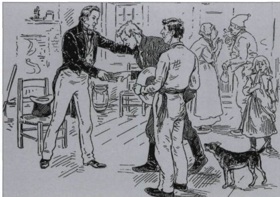
«Assermentation d'un membre des Frères Chasseurs». Gravure attribuée à Henri Julien vers 1871.