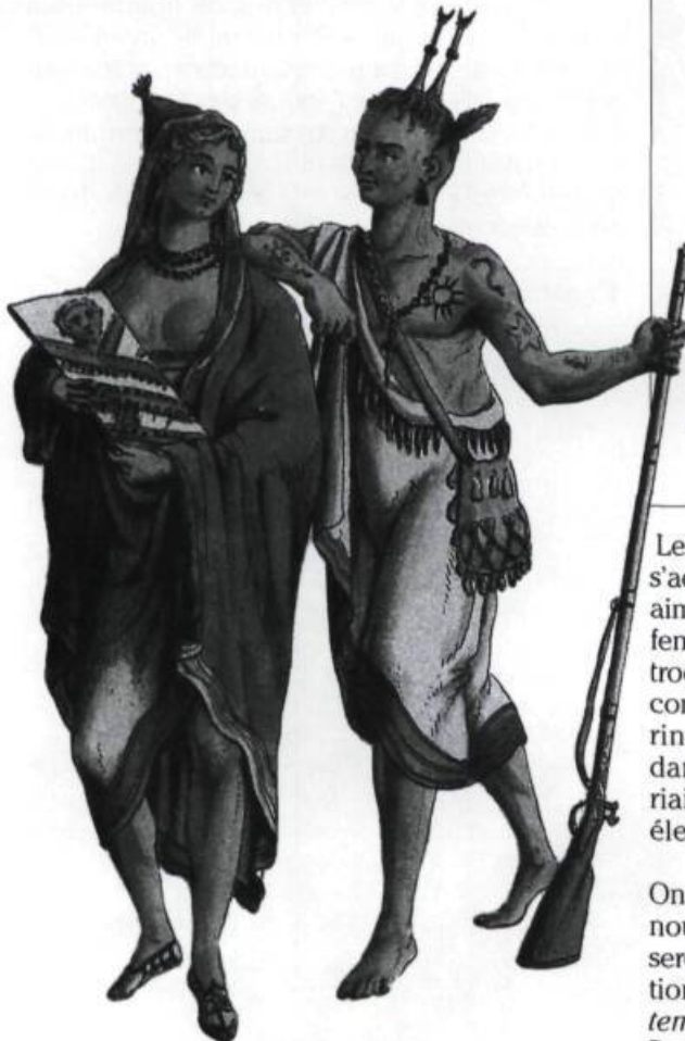
«Homme et femme iroquois». Gravure de Mixelle d'après une illustration de Grasset Saint-Sauveur, 1801. (Collection privée).

Le genre de vie que les Français ou les Anglais auront avec leur épouse autochtone dépendra du style de vie, mais aussi de la place qu'occupait le mari. «Was he an Englishman, or Frenchman or American? Was he a bourgeois of a lowly engage? Did he have an education or was he illiterate, a gentleman or not?»